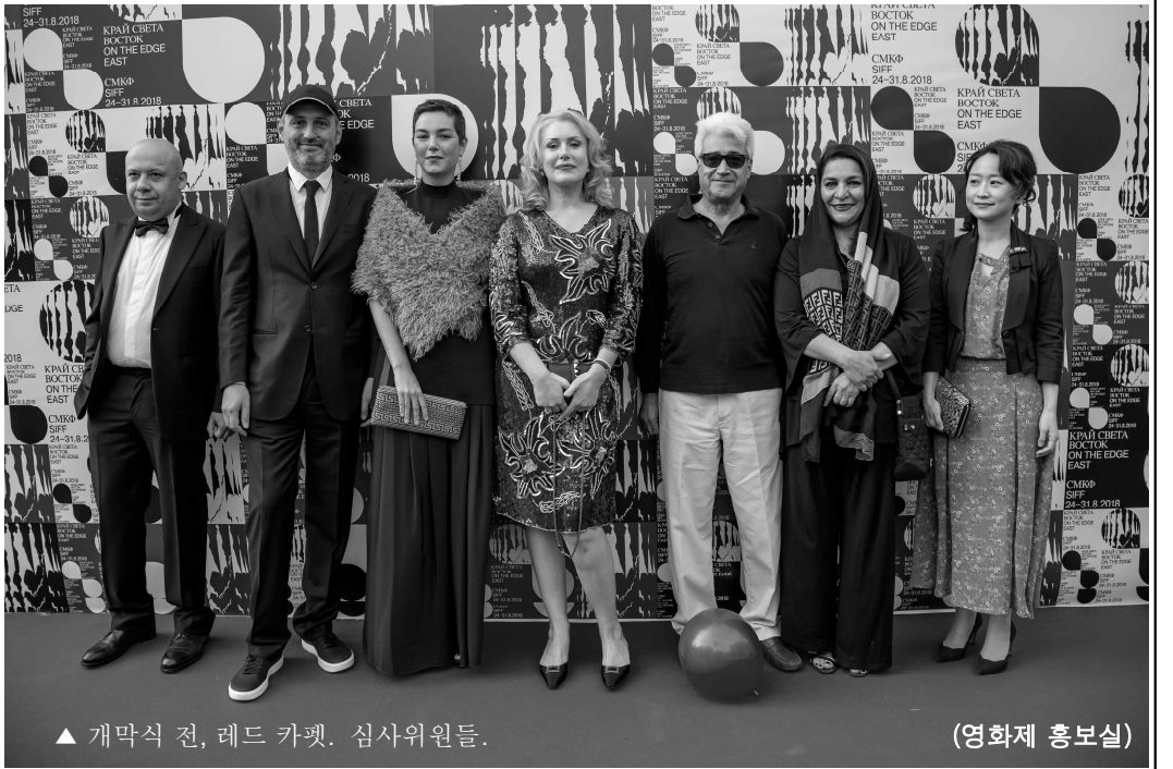
▲ 개막식 전, 레드 카펫. 심사위원들.