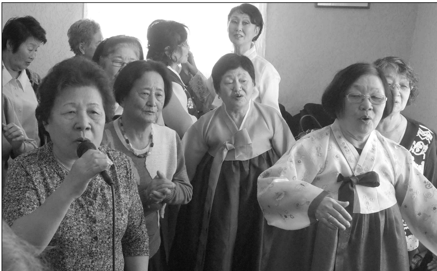
▲ 10월 1일은 러시아 노인들의 날이다. 사할린 한인 어르신들의 모습.