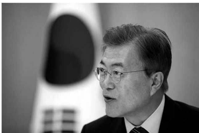
Мун Чжэ Ин: У России и Южной Кореи существует большой потенциал, который еще не исчерпан.

Справедливости ради надо сказать, что этому саммиту, между президентом Трампом и председателем Кимом, предшествовала ваша историческая встреча с председателем Кимом 27 апреля на границе Южной и Северной Кореи. Вы тогда сделали символический, и в то же время