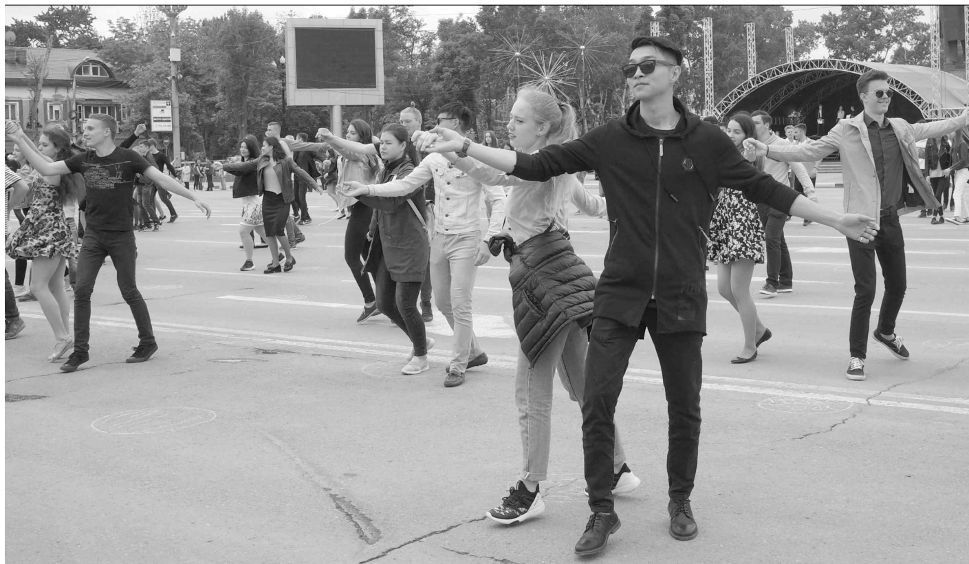
▲ 6월 27일에는 러시아에서 청년의 날 기념한다. 왈츠 연습을 하는 젊은이들.