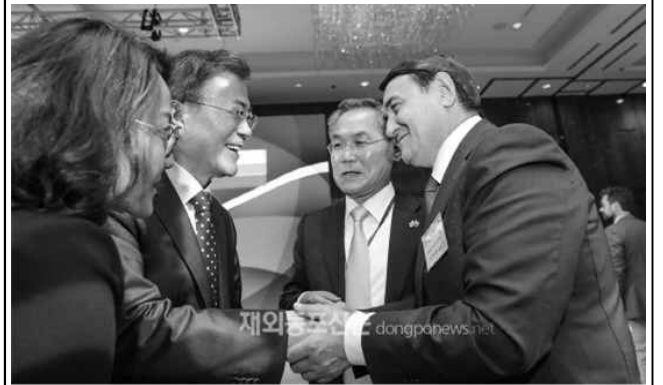
▲ 문재인 대통령은 6월 21일 모스크바 한 호텔에서 한-러 양국 우호 증진에 기여한 고려인 동포와 러시아 인사 등 200여 명을 초청한 가운데 '한러 우호·친선의 밤' 행사를 열었다. 초청 손님과 악수하는 문재인 대통령, 문 대통령 오른쪽은 우윤근 주러시아대사

러시아를 국빈방문 중인 문재인 대통령은 6월 21일(현지시간) 모스크바 한 호텔에서 한-러 양국 우호 증진에 기여한 고려인 동포와 러시아 인사 등 200여 명을 초청한 가운데 '한러 우호 친선의 밤' 행사를 열었다.