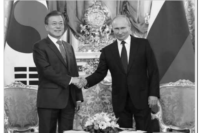
состоявшегося 22 июня в Москве южнокорейско-российского саммита.

Президенты РК и России договорились содействовать увеличению объёмов поставок российского природного газа в РК и продолжить взаимодействие в данной области, в том числе рассмотреть возможность совместного освоения месторождений нефти, газа и другого углеводородного сырья. Об этом говорится в совместном заявлении, которое было принято по итогам