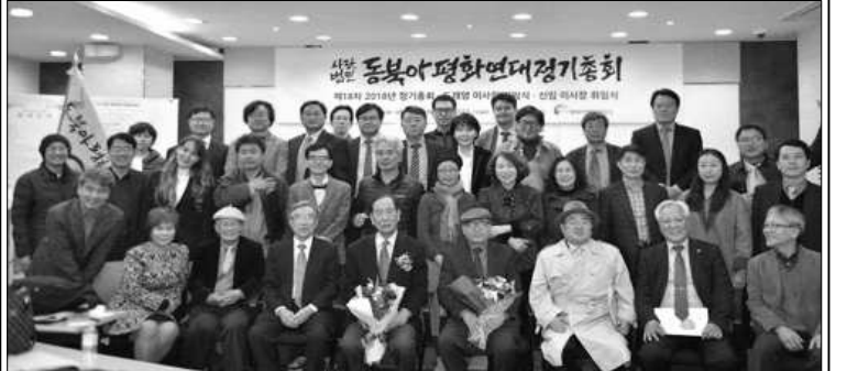
지난 14일 서울 용산구 삼경교육센터에서 열린 동북아평화연대 정기총회에서 참석자들이 기념촬영을 하고 있다.

북방동포 지원 비정부기구(NGO)인 동북아평화연대가 고려인문화센터 건립과 서울~평양~모스크바 1만5천km 자동차 랠리 등을 추진한다.