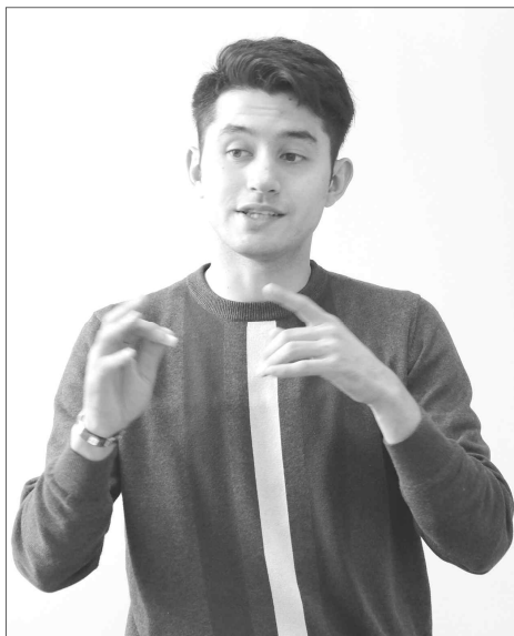
사위원들은 그에게 3위를 주었다.

한국어에 푹 빠진 청년은 사할린에서 공부하기로 결정하고 사할린국립대 한국어과(사법과정)를 전공하기로 결심했다고 한다. 그의 어머니의 생각에는 외국어 능력이 직업상 스펙 중 하나로 들어가지만 한국어 교사란 직업이 아들에게는 성격상으로 맞지 않을 거라고 했다. 아버지는 영어도 잘 하고 한국어 전공을 하는 것도 나쁘지 않다고 하셨다고 한다. 아무튼 학교를 우등으로 졸업한 이 선생이 오로지 입학 지원을 한 곳은 바로 사할린국립대 한국어과였다. 한국어를 좀 배웠기 때문에 처음 1학년까지는 공부하기가 수월했다고 한다. 2학년 지나 갑자기 어려워지면서 한국어 실습이 부족함을 느꼈다고 한다. 때마침 경주대학에서 6개월 한국어코스가 있어 그는 경주대학에서 유학하게 되었다.