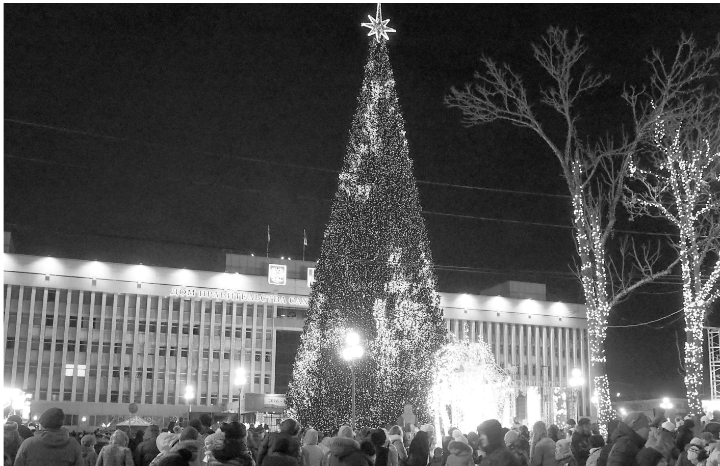
▲ 지난 15일(토) сахалин주 정부 청사 앞마당에서 4500여 명이 모인 가운데 сахалин주 주요 율카 점화식이 있었다. 이날 주민들은 이와 관련한 공연을 관람하고 이들을 율레리 리마렌코 주지사 권한 대행이 환영했다. 행사의 마지막은 불꽃놀이로 장식했다.