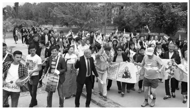
(Источник: сайт «Коре сарам»)