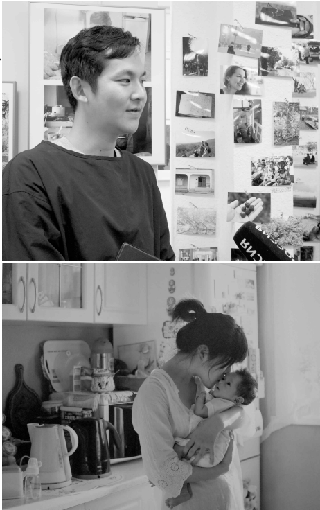
(취재: 글/배순신)

"가족사진, 일상의 장면이 사람들의 마음에 무엇보다 와닿습니다. 그래서 제가 이런 촬영 스타일을 선택했습니다. 일본에서 이 전시를 할 때 관객들이 사진 주인공과 가까이 있는 것 같았고 이들에게서 삶의 분위기를 느꼈다."고 작가는 설명했다.