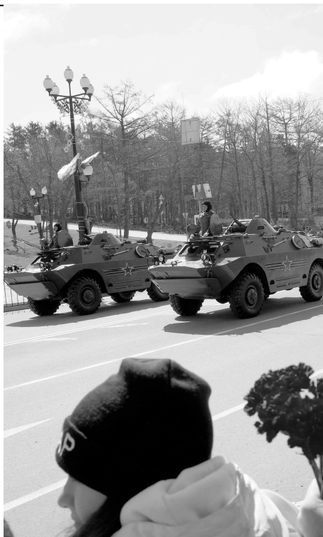
▲ 지난 5월 9일 전 러시아가 대조국전쟁 승리 73주년을 기념했다. 유즈노사할린스크에서 주요행사는 <포베다(승리)> 광장과 <슬라와(영예)>광장에서 펼쳐졌다.