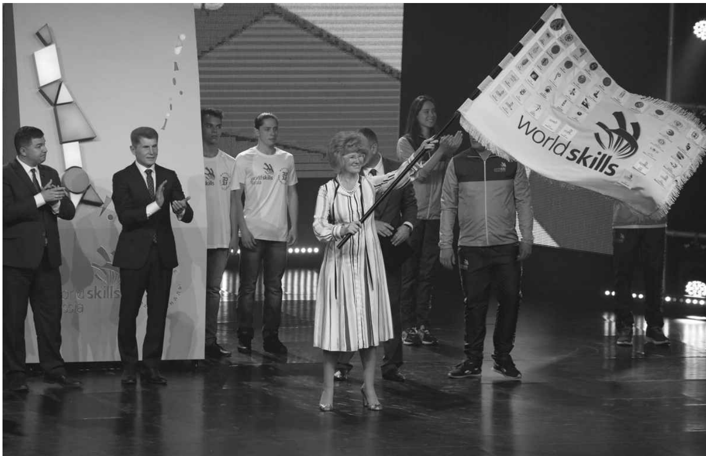
▲ 지난 8일 <크리스탈>스포츠회관에서 약 3000명이 모인 가운데 러시아기능올림픽 챔피언대회를 성화리에 개막했다.