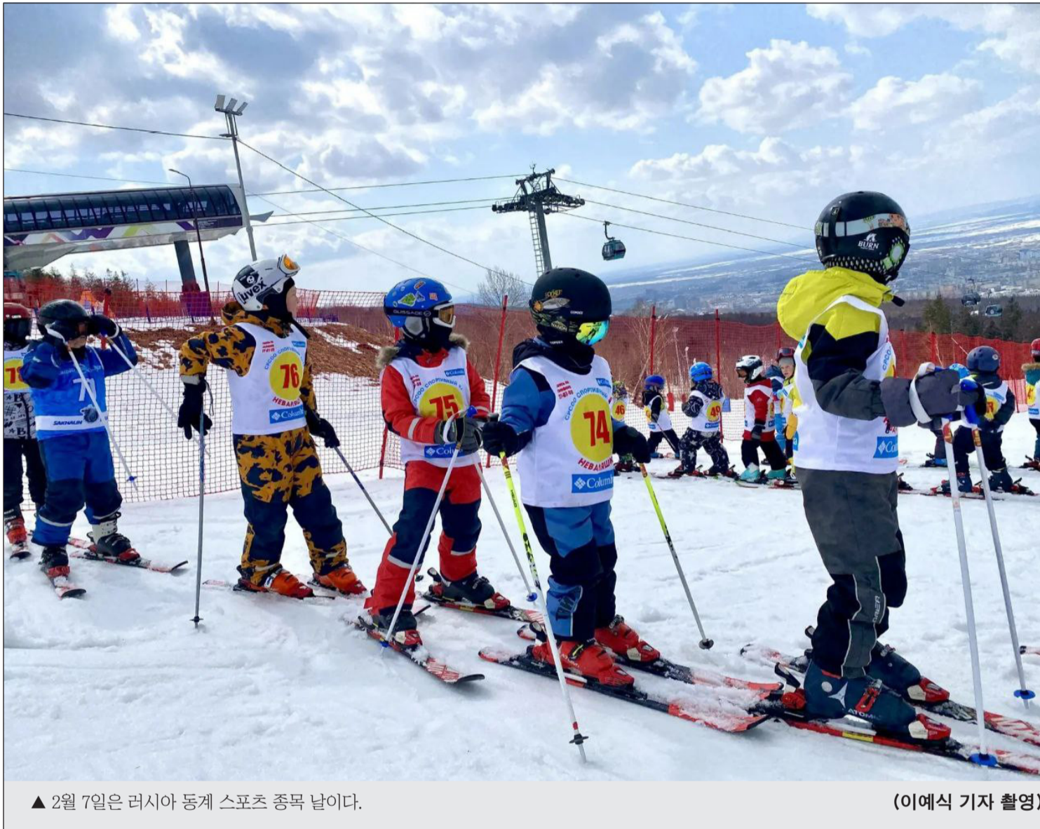
▲ 2월 7일은 러시아 동계 스포츠 종목 날이다.

2026년 2월 6일(금) (음력 12월 19일) Пятница 6 февраля 2026 г. № 5 (12172) 1949년 6월 1일 창간 ----- Цена свободная