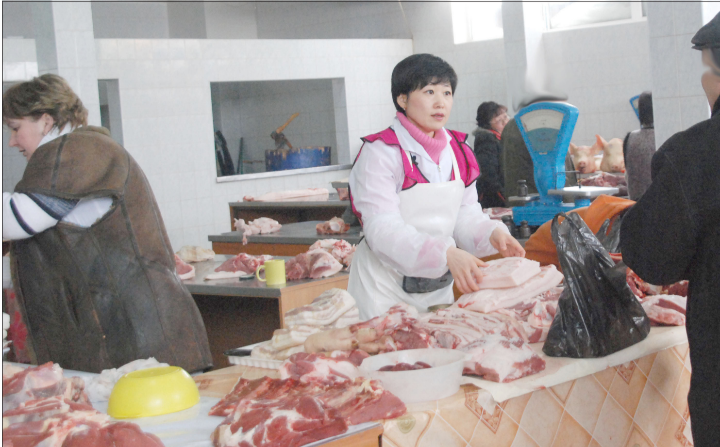
▲ 7월의 네번째 토요일 러시아에서 상업 근로자들의 날로 기념한다. 올해 이 기념일은 7월 26일이다.

2025년 7월 25일(금) --(윤력 윤6월 1일)-- Пятница 25 июля 2025 г. № 29 (12146) 1949년 6월 1일 창간 ----- Цена свободная