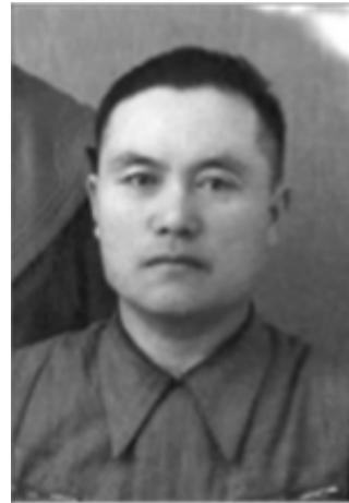
С.В. Кан г. Кизляр, Дагестанская АССР 1956 г.

Родился 17 августа 1905 г. в д. Таванен Приморской области Приамурского края. В юном возрасте сражался на фронтах Гражданской войны. В начале 1920-х гг. направлен на учебу в полковую школу КВЖД. В 1929 г. принимал участие в боевых действиях на КВЖД. Награжден орденом Красного Знамени.