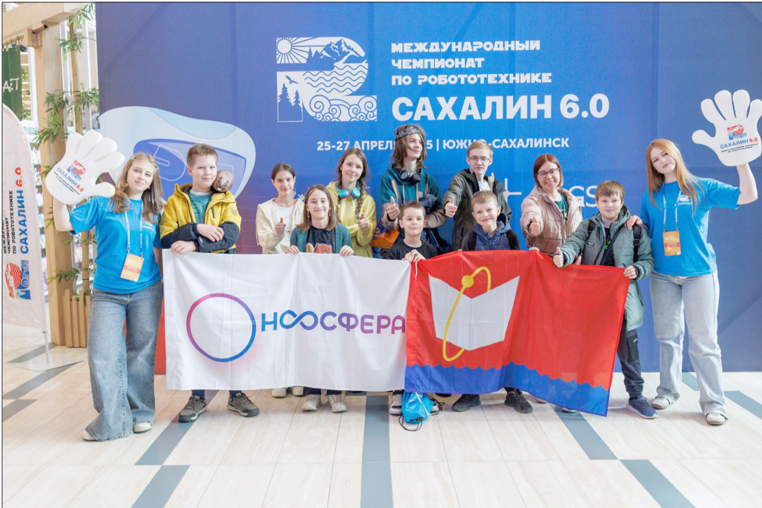
▲ 4월 25일 사할린에서 제6회 국제 로봇공학 챔피언대회 "사할린 6.0"이 열린다. 유즈노사할린스크 공항에 도착한 참가자 기념사진 촬영중.

2025년 4월 25일(금) --(음력 3월 28일)-- Пятница 25 апреля 2025 г. № 16 (12133) 1949년 6월 1일 창간 ----- Цена свободная