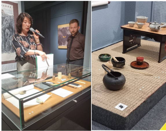
구와 장식공예품, 산수화 작품을 통해 동양적 세계관의 정교함이 구현됐다.

특히 도교와 선불교 같은 종교·철학 사상의 연계성, 동양 예술가·시인·사상가들에게 영감의 원천이 된 자연의 역할에 초점을 맞췄다. 16세기, 18세기, 20세기 초 제작된 물병, 차주전자, 거품기, 술잔, 찻잔 등 희귀 차 도