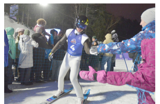
(취재: 글/배순신 기자)