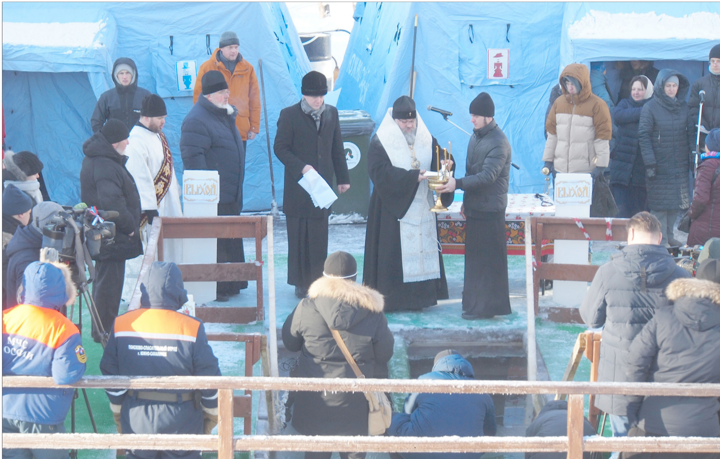
▲ 1월 19일 러시아 정교회에서 주현절을 기념한다. 이날 유즈노사할린스크 시공원 웨르흐네에 호수에 구멍을 뚫고 성수식을 갖는다.

2025년 1월 17일(금) --(윤력 12월 18일)-- Пятница 17 января 2025 г. № 2 (12119) 1949년 6월 1일 창간 ----- Цена свободная