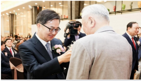
9일 제53회 어버이날 기념행사에서 김동연 경기도지사가 임종선 사할린동포에게 카네이션을 달아주고 있다.

특히 김동연 지사는 이날 일제강점기 강제 동원으로 고향을 떠나 평생 고국을 그리워하다 영주 귀국한 사할린 동포 어르신들을 특별 초청해 역사적 의미를 더했다. 경기도