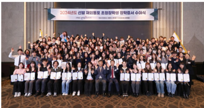
21개국에 걸쳐 100명을 선발한 2024년 재외동포초청장학생 장학증서 수여식 모습.

*문의: 재외동포협력센터 장학사업 담당자 (scholarship@okocc.or.kr)