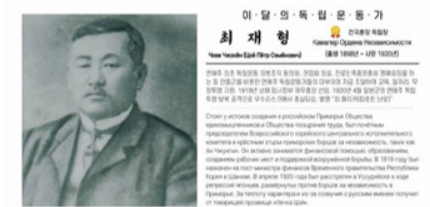
03 MARCH 2025