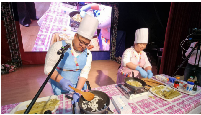
(취재: 드미트리 포구다예브, 배순민)