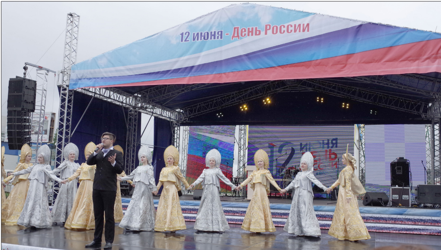
▲ 6월 12일은 러시아의 날이다. 이 국경일은 러시아 소비에트 연방 사회주의 공화국의 국가 주권에 대한 선언이 채택된 날로서 이 선언문은 1990년 6월 12일에 승인되었다. 다음해부터 이날은 공식적인 국경일이 되었고, 이후 '러시아의 날'로 명명되었다. 유즈노사할린스크시 '러시아의 날' 기념 행사장에서.

2025년 6월 13일(금) --(음력 5월 18일)-- Пятница 13 июня 2025 г. № 23 (12140) 1949년 6월 1일 창간 ----- Цена свободная