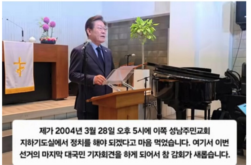
제가 2004년 3월 28일 오후 5시에 이쪽 성남주민교회 지하기도실에서 정치를 해야 되겠다고 마음 먹었습니다. 여기서 이번 선거의 마지막 대국민 기자회견을 하게 되어서 참 감회가 새롭습니다.

빈민 지역 교회서 일궈낸 '청년 이재명'의 서사... 법률상담 봉사하며 인생 방향 정해