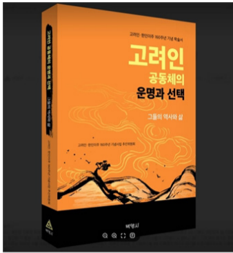
'고려인 공동체의 운명과 선택' 표지

(서울=연합뉴스) 박현수 기자 = 1863년, 함경북도 농민들이 연해주로 건너가며 시작된 한인의 러시아 이주가 160주년을 맞았다. 이를 기념해 국내 학계와 시민사회가 힘을 모아 기록한 '고려인 공동체의 운명과 선택: 그들의 역사와 삶'(박영사)이 최근 출간됐다.