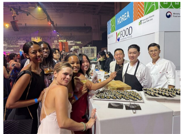
aT는 지난 3일 미국 워싱턴 DC에서 개최된 '제43회 라미 어워즈'에 참가해 참가자들과 K-푸드 시식행사를 개최했다고 밝혔다.

앞서 aT는 '2025 APEC 식량안보장관회의(FSMM)'와 연계해 8월4일부터 10일까지 인천 송도 컨벤시아에서 '농식품 홍보관'을 운영하며 K-푸드의 우수성과 브랜드 가치를 집중 홍보하고 있다.