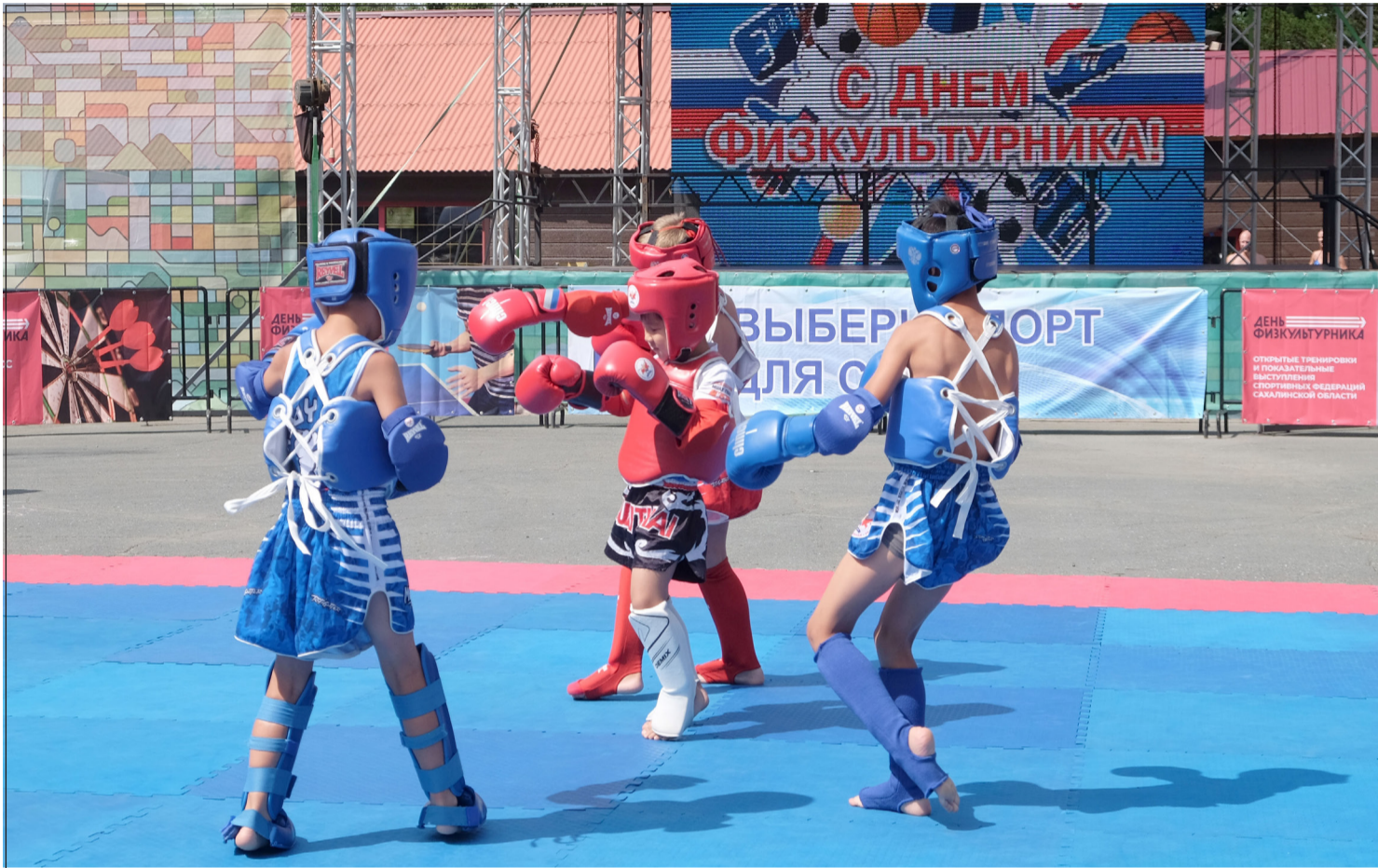
▲ 8월 9일은 체육인의 날이다.