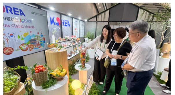
aT는 지난 4일부터 10일까지 인천 송도 컨벤시아에서 APEC 식량안보장관회의와 연계해 '농식품 홍보관'을 운영하고 있다.

aT는 이번 회의에 각국 농업 관련 정책을 총괄하는 고위 관계자들이 대거 참석하는 만큼, 농식품 홍보관을 통해 K-푸드의 경쟁력과 성장 가능성을 소개해 수출 확대 계기를 마련한다는 방침이다. 홍보관은 '수출농식품관'과 '전통식품관'으로 구성해 운영한다.