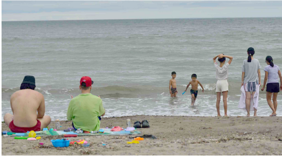
사진: 아니아 해변에서 휴식을 즐기는 사람들. (이예식 기자)