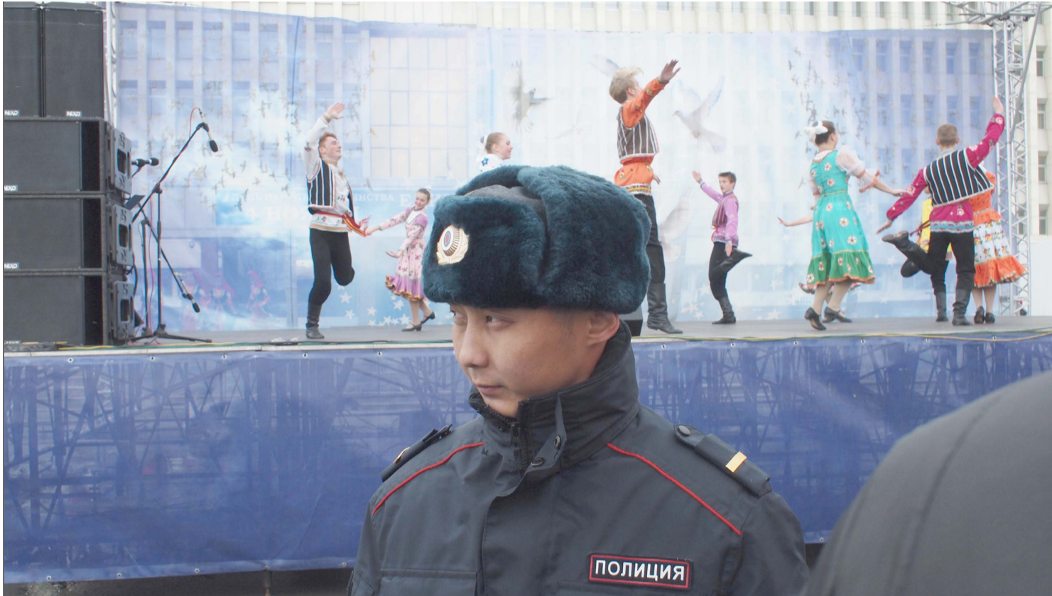
▲ 11월 10일은 러시아에서 내무부 직원(경찰관)의 날로 기념한다.

2025년 11월 7일(금) ..(윤력 9월 18일).. Пятница 7 ноября 2025 г. № 43 (12160) 1949년 6월 1일 창간 ..... Цена свободная