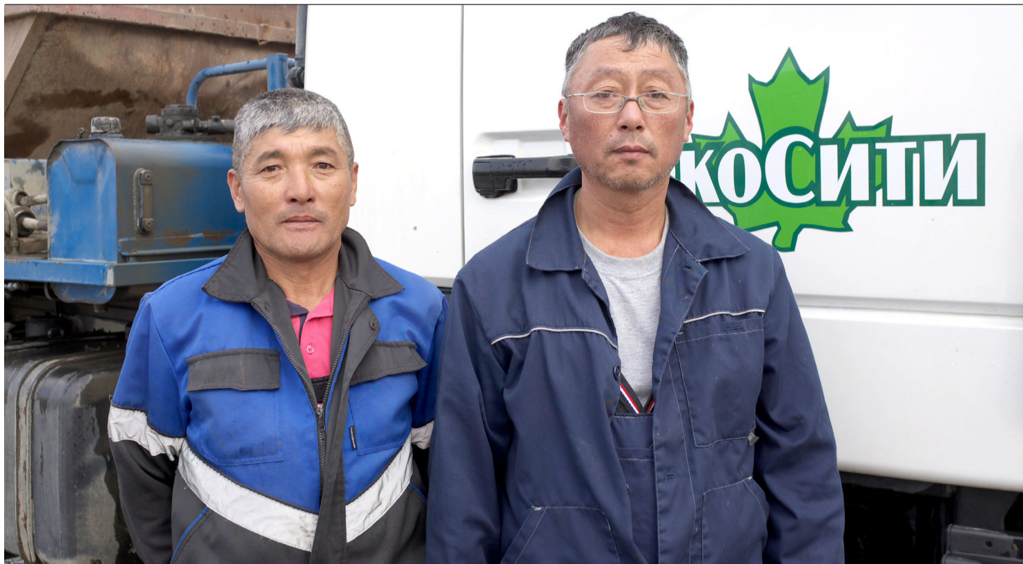
▲10월의 마지막 일요일은 러시아에서 자동차 운전자의 날로 기념한다. 운전하는 모든 사람들이 즐기는 날이다.

2024년 10월 25일(금) --(음력 9월 23일)-- Пятница 25 октября 2024 г. № 42 (12109) 1949년 6월 1일 창간 ----- Цена свободная