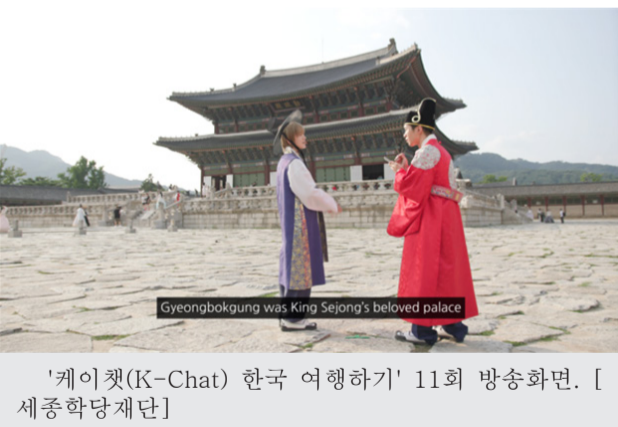
'케이챗(K-Chat) 한국 여행하기' 11회 방송화면.