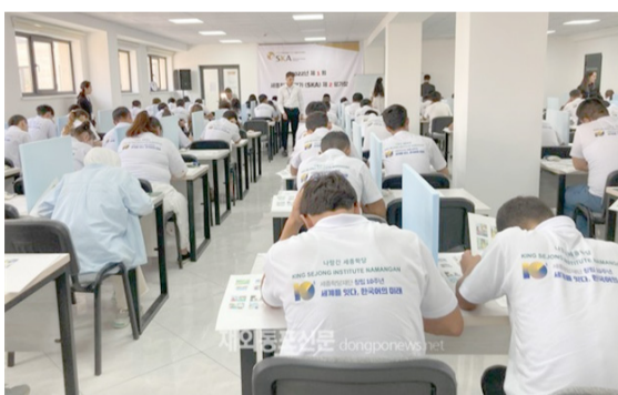
지난해 우즈베키스탄 나만간 세종학당에서 학습자들이 세종한국어평가(SK A)에 응시하고 있다.

전 공모를 통해 선정된 남미, 아시아, 아프리카, 유럽 지역 14개국 23개소 세종학당에서 치러진다.