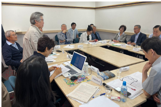
6월 1일(목) 첫 좌담회에서 토론하는 모습