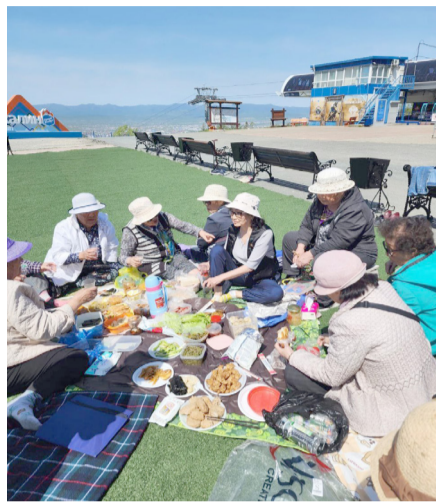
(배순신 기자)