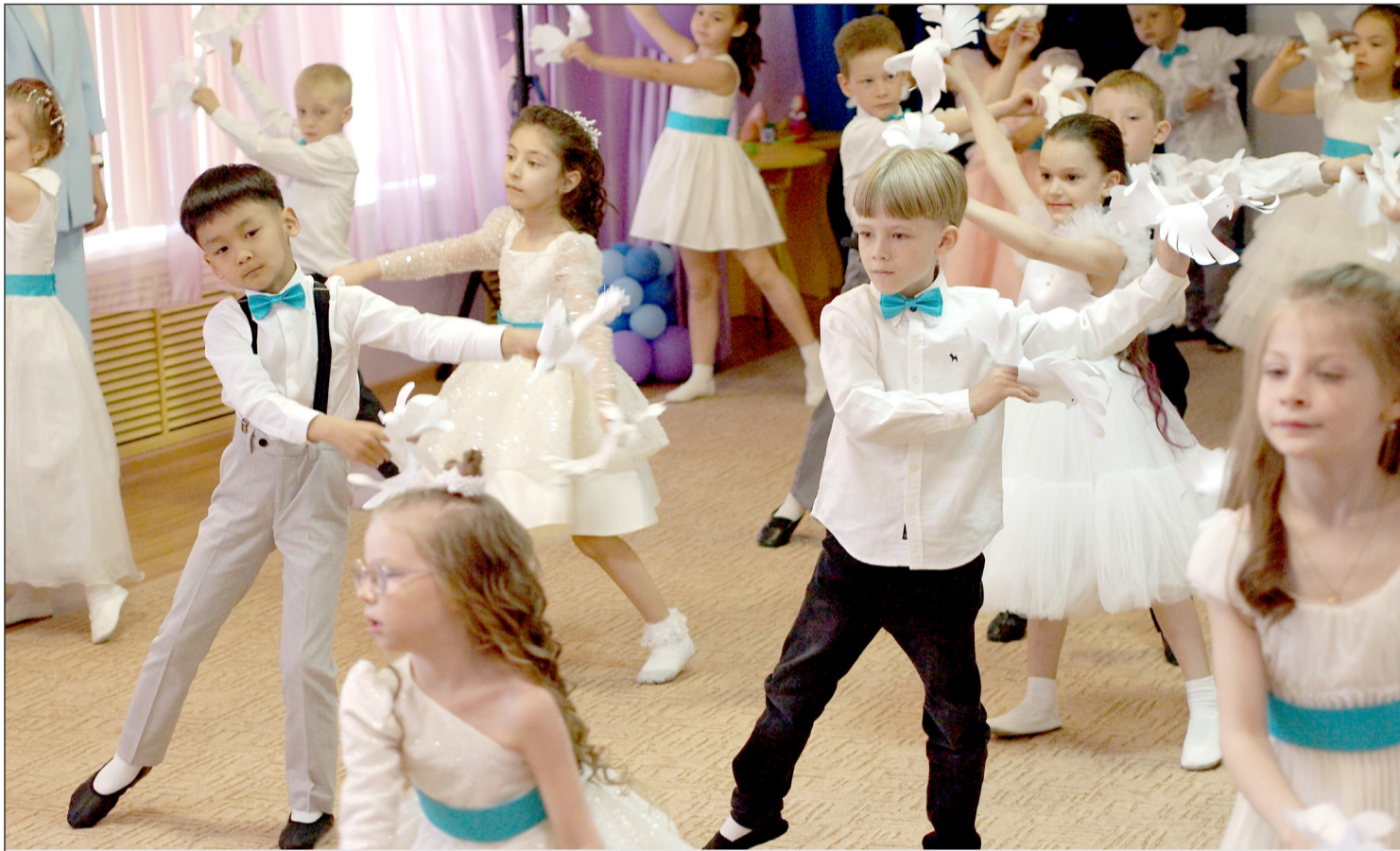
▲ 6월 1일은 국제 어린이 보호의 날이다.

2023년 6월 2일(금) --(음력 4월 14일)-- Пятница 2 июня 2023 г. № 21 (12038) 1949년 6월 1일 창간 ----- Цена свободная