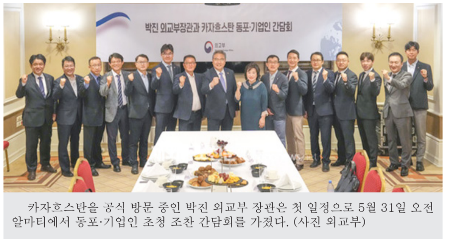
카자흐스탄을 공식 방문 중인 박진 외교부 장관은 첫 일정으로 5월 31일 오전 알마티에서 동포·기업인 초청 조찬 간담회를 가졌다.

박 장관은 이어 "세계 9위의 광대한 국토와 풍부한 광물자원을 가진 카자흐스탄이 우크라이나 사태와 세계적인 공급망 위기 속에 우리 기업의 새로운 활동 무대로 주목받고 있다"면서, "카자흐스탄과 플랜트,