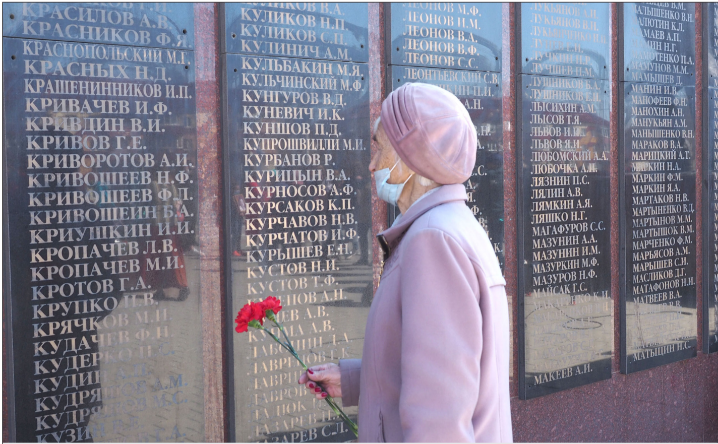
▲ 유즈노사할린스크시 슬라와 광장.

2022년 6월 24일(금) --(음력 5월 26일)-- Пятница 24 июня 2022г. № 24 (11991) 1949년 6월 1일 창간 ----- Цена свободная