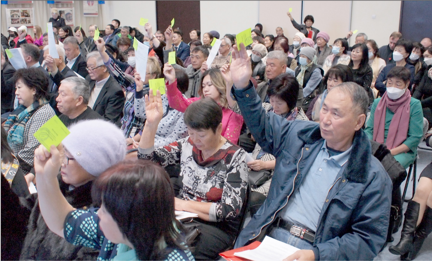
▲ 지난 17일(토) 유즈노사할린스크시 한인문화센터에서 사할린주 한인협회 결산 및 선거 대표자 회의가 소집됐다.

2022년 12월 23일(금) ...(음력 12월 1일)... Пятница 23 декабря 2022г. № 49 (12016) 1949년 6월 1일 창간 ..... Цена свободная