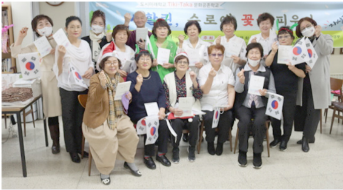
▲김해시 장유 사할린 동포들이 자서전 발표회를 가졌다.