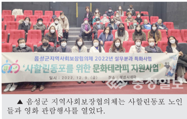
▲ 음성군 지역사회보장협의체는 사할린동포 노인들과 영화 관람행사를 열었다.