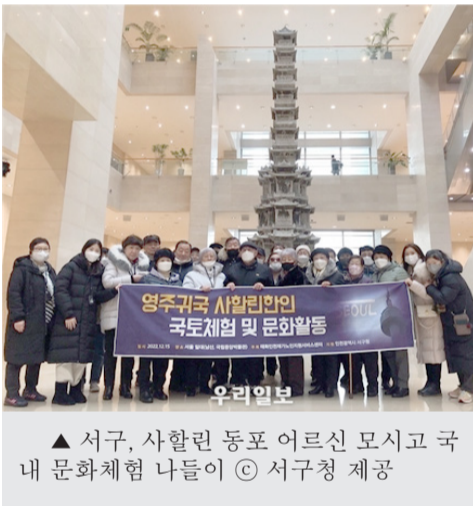
▲ 서구, 사할린 동포 어르신 모시고 국내 문화체험 나들이