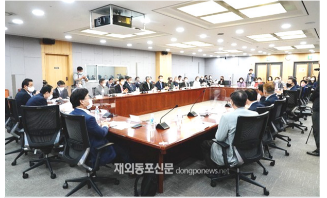
'재외동포의 명칭과 한인회 등록제 정책토론회'가 지난 9월 30일 여의도 국회의원회관 제1세미나실에서 열렸다.

한인회 등록제에 대해선 미주한인 72%, 이외 지역 84.8%가 "한인회 발전에 도움이 된다"고 답했다. 이어 '한인회등록제가 한인회 난립과 갈등을 예방할 수 있다고 보느냐'는 질문에는 미주지역 61.7%, 이외지역 73.9%가 "예방할 수 있다"고 답하는 등