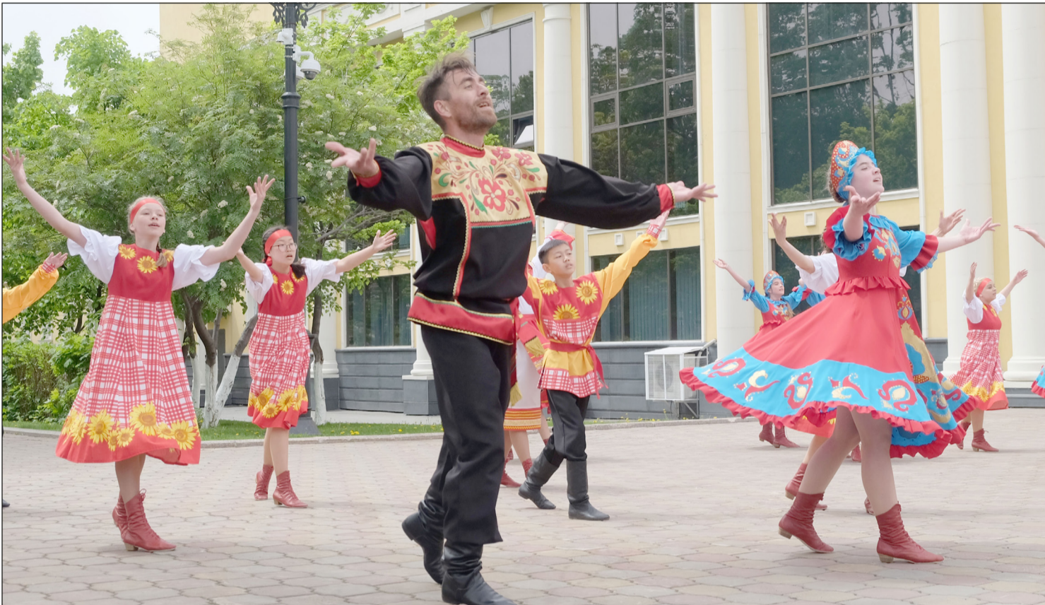
▲ 6월 27일 러시아에서는 청년의 날을 기념한다.

2021년 6월 25일(금) ...(음력 5월 16일)... Пятница 25 июня 2021г. № 25 (11942) 1949년 6월 1일 창간 ..... Цена свободная