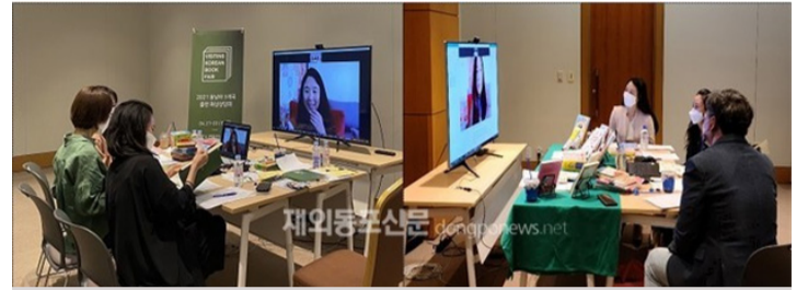
2021년 '찾아가는 도서전' 온라인 화상 상담 모습

문화체육관광부(장관 황희)는 한국출판문화산업진흥원(원장 김수영)과 함께 6월 21일부터 23일까지 서울 코엑스 콘퍼런스룸 319~326호에서 국내 출판기업의