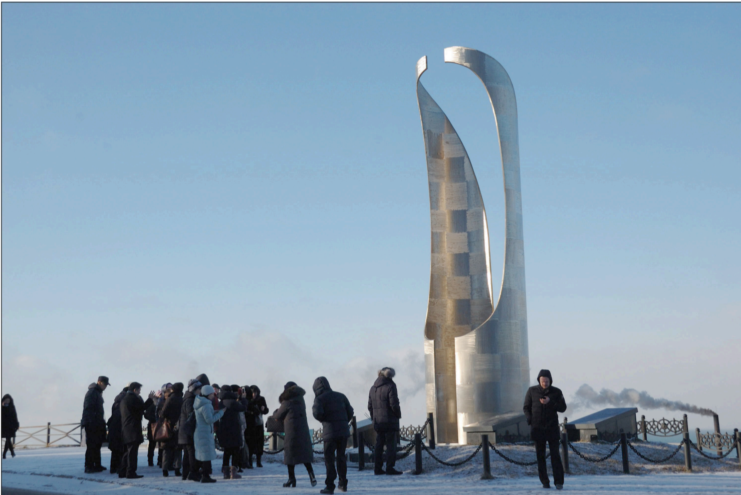
4월18일은 세계 문화 유적 및 기념물의 날이다. ▲ 코르사코브시 방향의 언덕. 사할린 희생동포 기념위령탑.

2021년 4월16일(금) (윤력 3월 5일) Пятница 16 апреля 2021г. № 15 (11932) 1949년 6월 1일 창간 Цена свободная