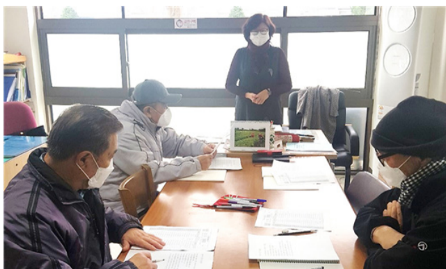
음성군이 음성읍 거주 사할린 동포들을 대상으로 한국의 교육을 위해 '찾아가는 문해교실-사할린 동포 소통반'을 운영하고 있다.