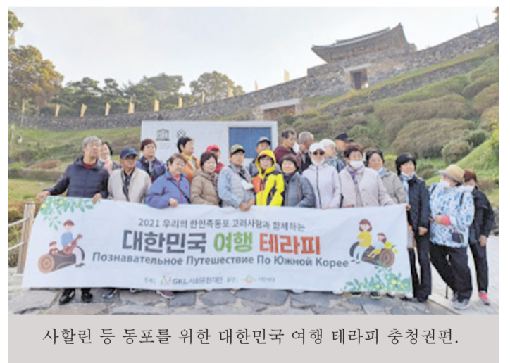
사할린 등 동포를 위한 대한민국 여행 테라피 충청권편.

공주, 부여, 익산 외에, 경기권(양평), 강원권(강릉, 인제), 전라권(목포, 나주), 경상권(경주, 울산)등에서도 진행되고 있다. 문화 역사 탐방, 농촌 체험 테마 등 프로그램에 참여하는 것이다.