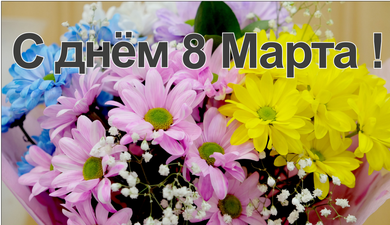
▲ 3월 8일은 세계 여성의 날이다.

2021년 3월5일(금) --(음력 1월 22일)-- Пятница 5 марта 2021г. № 9 (11926) 1949년 6월 1일 창간 ----- Цена свободная