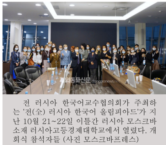
전 러시아 한국어교수협의회가 주최하는 '전(全) 러시아 한국어 올림피아드'가 지난 10월 21~22일 이틀간 러시아 모스크바 소재 러시아고등경제대학교에서 열렸다. 개회식 참석자들

이번 대회는 러시아의 코로나 방역수칙을 엄수한 가운데, 러-한 번역, 한-러 번역, 한국어 작문, 한국어 말하기 등 4개 분야별로 진행됐다.