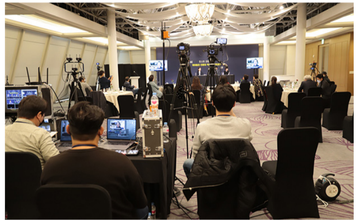
국제심포지엄은 코로나 19 여파로 온라인과 오프라인을 병행한 하이브리드 방식으로 열렸으며 사회적 거리두기를 고려해 현장 참석자는 30명 미만으로 한정했다.

(서울)세계한인언론인협회 공동취재단 = 21일(수) 개막한 제19회 세계한인언론인대회는 22일(목) 제10회 세계한인언론인 국제 심포지엄으로 이어졌다.