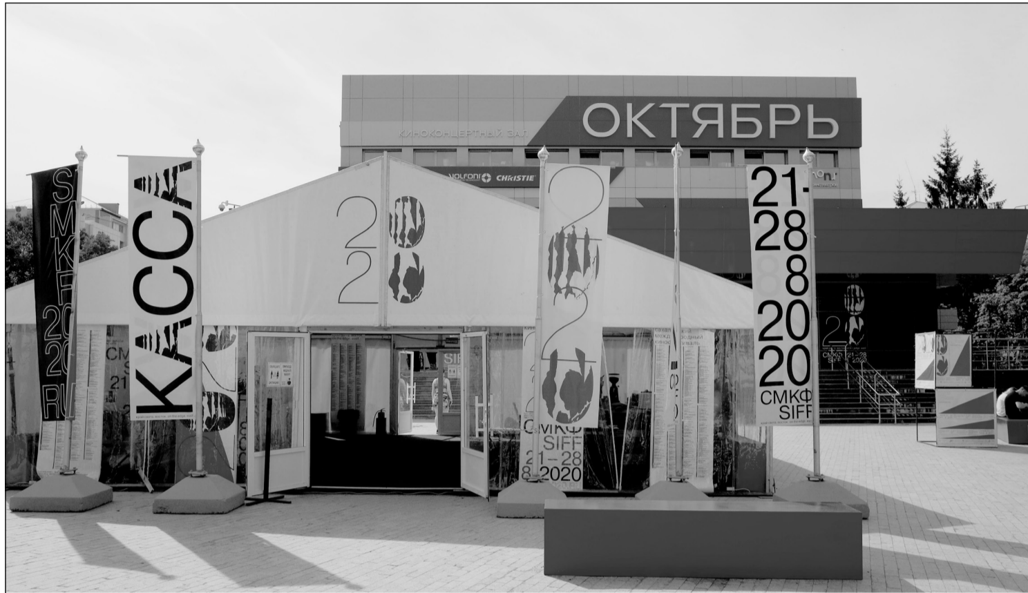
▲ 8월 21일-28일 간 유즈노사할린스크에서 <크라이 스웨타 (세界的 끝)>국제영화제가 진행되었다. 코로나19 팬데믹으로 영화관에 서도 좌석 간 거리두기를 한다.