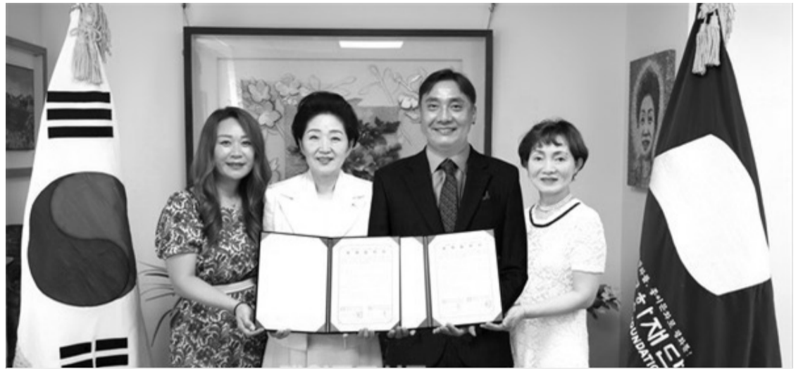
종이문화재단·세계종이접기연합은 8월 26일 서울 장충동 소재 종이문화재단 사무실에서 러시아한글학교협의회와 'K-종이접기' 문화 러시아 확산을 위한 업무협약을 체결했다.