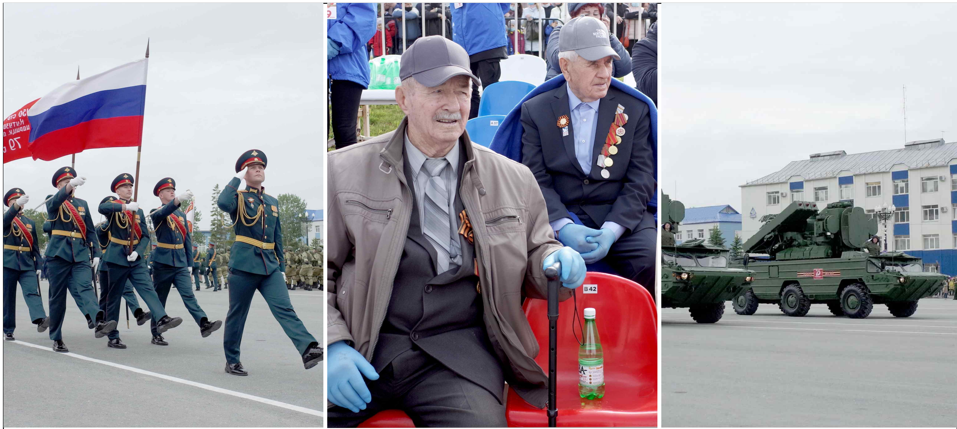
▲ 6월 24일, 유즈노사할린스크시. 대조국전쟁 승리 75주년 기념 열병식..