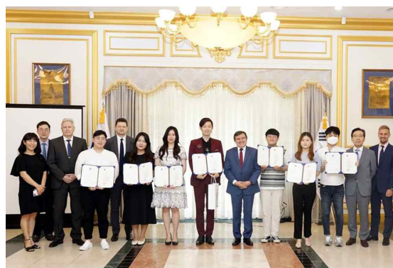
Посольство РФ в Сеуле

В этом году организаторы решили дать шанс проявить себя студентам, которые проживали и проходили обучение в России и других странах СНГ на протяжении недолгого времени. Поэтому участие в конкурсе приняли лишь те студенты, срок языковых стажировок которых составляет не более двух лет. В борьбе за звание лучшего знатока русского языка сошлись около 40 студентов, которые представляли самые разные высшие учебные заведения Республики Корея. Темами юбилейного конкурса стали 75-летие Победы в Великой Отече-