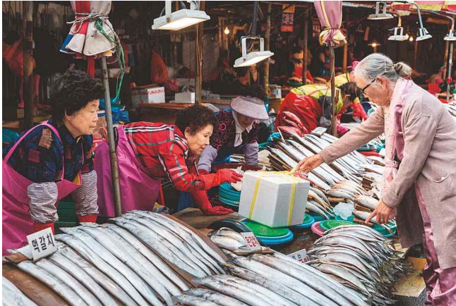
해운대 미포항에서 한 할머니가 하역을 마친 생선들을 크기와 종류별로 선별해 상자에 담고 있다.

해마다 가을에 열리는 자갈치 시장 축제도 그 범위 안에서 벌어진다. 시저의 명언을 연상케 하는 "오이소! 보이소! 사이소!"라는 캐치프레이즈는 이 축제의 성격을 간결하고 함축적으로 말해 준다. 상인들은 장을 보러 온 흥 많은 손님들을 위해 며칠간 춤과 노래는 물론이고 맨손으로 물고기 잡기에서 먹거리 무료 시식까지 시골벽적이고 아기자기한 행사들을 벌인다.