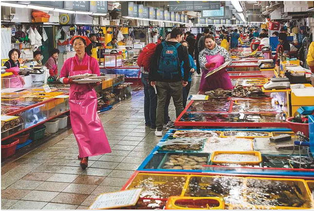
부산항 남쪽에 위치한 자갈치시장은 총 4,841㎡ 면적의 갈매기를 상징하는 건물로 건물 안팎에 700 곳이 넘는 점포가 밀집해 있다. 1층에는 해산물 점포, 2층에는 식당이 있다. 자갈로 덮인 어촌 해안에서 오랫동안 난전을 이루던 상인들이 자금을 모아 1972년 정식 시장으로 개장했다.

부산의 대표적 전통 시장인 자갈치 시장은 많은 시민들과 관광객들이 찾는 명소이다. 이 시장이 위치한 남포동은 주먹만 한 굵은 자갈들이 해안가에 깔려 있는 아름다운 어촌이었다. 어민들이 작은 고깃배로 잡은 해산물을 파는 노점상들이 해안 일대에 하나둘 생기면서 시장이 형성되었고, 1970년대 초반에 정식 시장으로 개설되었다.