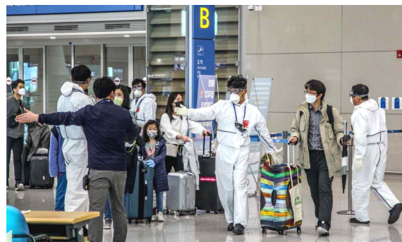
Выходящих из зоны досмотра сразу встречают сотрудники минздрава Кореи и отправляют к пунктам тестирования на коронавирус.

"Среди повторно заболевших много представителей возрастных групп 20-29 лет и 50-59 лет, но