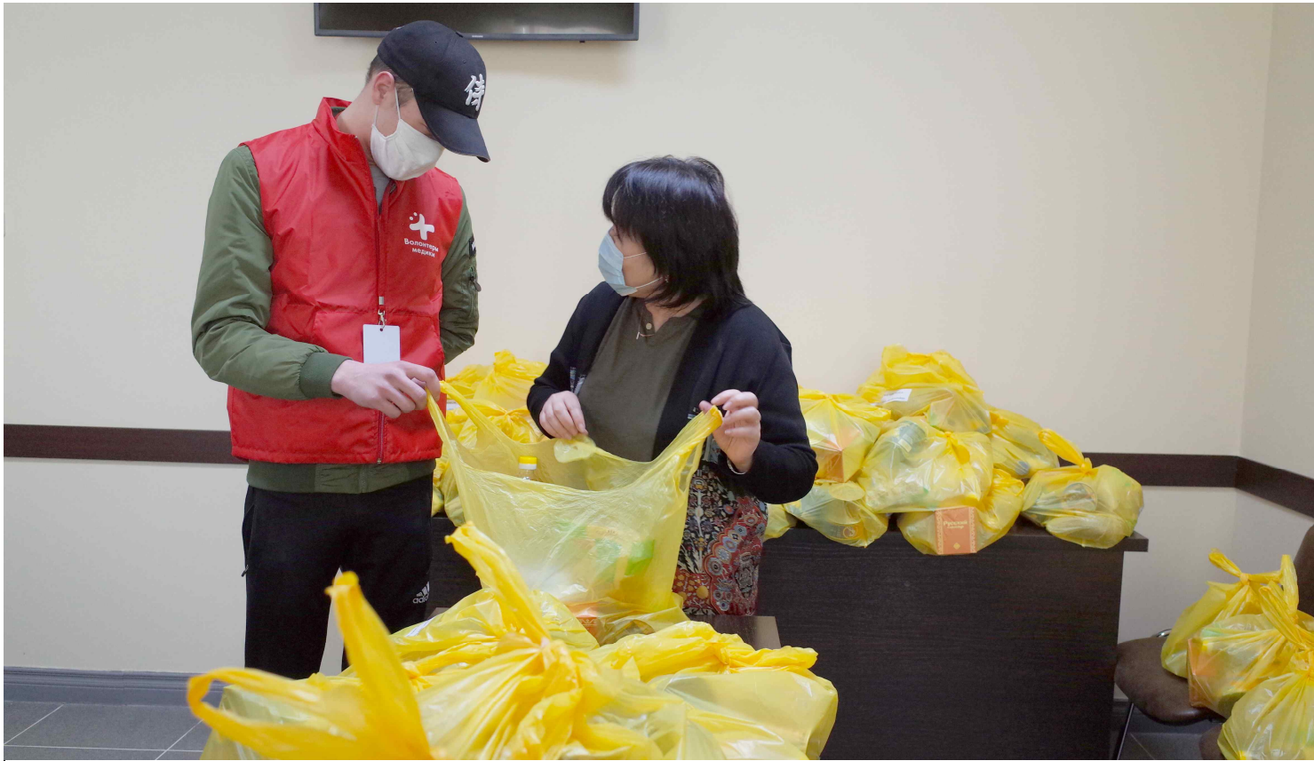
▲ 사할린주 한인협회에서 지원이 필요한 어르신들을 위해 식품세트 100개를 준비해 전달했다. 관련 기사 3면 게재.