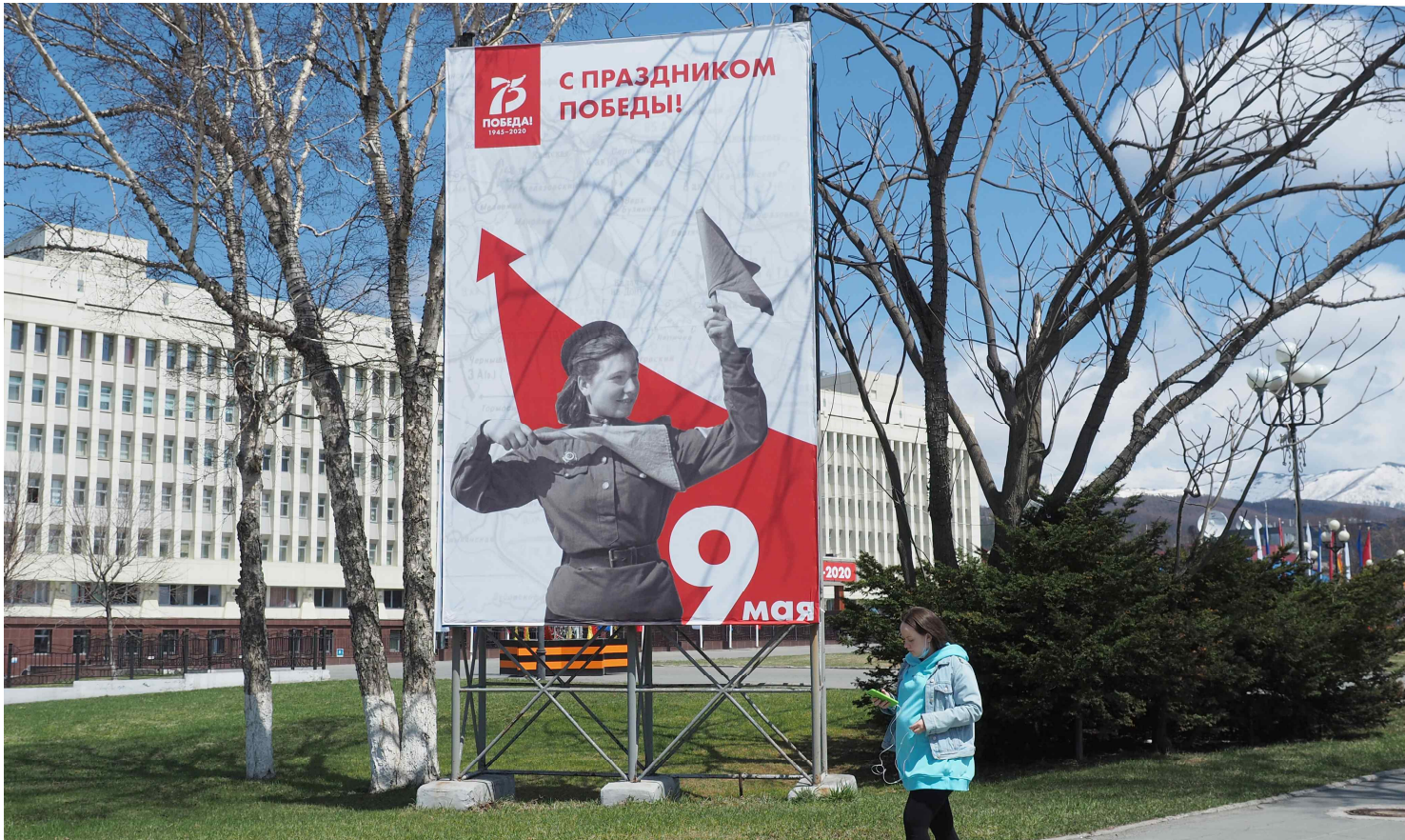
▲ 5월 9일은 승리의 날이다. 올해는 대조국 전쟁 대승 75주년이다.