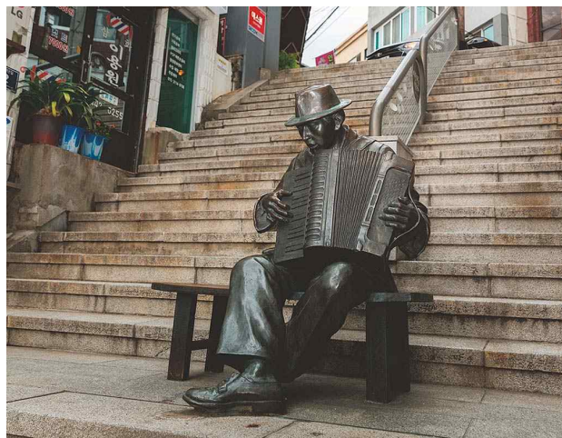
중앙동 40계단은 판자촌에서 임시로 거주하던 피난민들이 매일 물동이를 지고 오르내렸던 곳이다. 당시 이곳에 살던 피난민들의 모습을 담은 여러 조형물들이 설치되어 있다.

마을 곳곳마다 어느 방향으로 가도 골목과 골목이 만나고, 가파른 경사의 계단과 계단이 만난다. 골목은 가로로 집들을 이어주고, 계단은 세로로 골목들을 이어준다. 현재는 도시 재생 사업의 일환으로 기존 마을을 깨끗하게 보존하고 곳곳에 공공미술 작품을 설치하여 문화예술 마을로 탈바꿈했다. 「르몽드」나 CNN 등 해외 언론이 적극 추천한 장소이기도 하다.