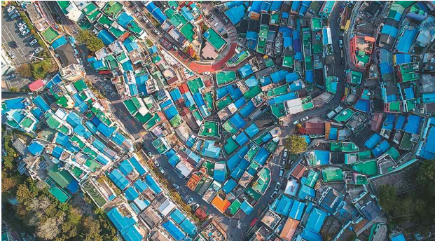
부산 남서쪽에 자리하고 있는 감천동은 1950년대 중반 태극도(太極道) 교도들이 산 중턱으로 집단 이주하며 형성된 마을이다. 산자락을 따라 계단식으로 늘어선 주택들과 미로 같은 골목길들이 독특한 풍경을 만들어 낸다.

1950년 6월 한국전쟁이 발발한 후 대한민국의 임시 수도가 된 부산은 휴전협정으로 전쟁이 끝나고 1953년 8월 15일 정부가 서울로 돌아갈 때까지 실질적인 수도의 역할을 했다. 임시 수도의 정부 청사로 사용했던 당시 경상남도청 인근 동네에는 피난민들이 대거 몰려들어 기약할 수 없는 타향살이를 시작했다. 그 애환의 흔적이 지금까지 남아 지나간 역사를 돌아보게 한다.