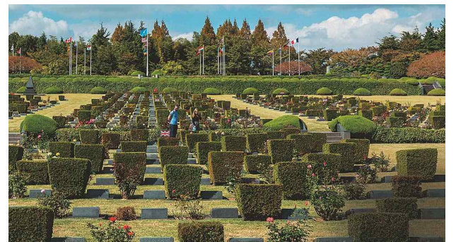
UN기념공원 묘지는 한국전쟁에 참전했다가 전사한 UN군들의 유해를 매장하기 위해 UN군 사령부가 조성한 곳으로 1951년 4월 완공되었다. 21개 참전국들의 국기와 UN기가 연중 게양되고 국내외 많은 방문객들의 참배가 이어지고 있다.

부평깡통시장은 부산을 대표하는 음식의 발상지로도 유명했다. 부산어묵이 처음으로 태어난 곳이면서 피난 시절에는 부산돼지국밥이 만들어졌다. 또한 사람들은 미군부대 군인들이 먹다 남긴 잔반을 걷어서 죽을 만들어 팔기도 했다. 일명 '꿀꿀이죽', 'UN탕'이라고 불리던 이 음식은 부대찌개의 원조라 할 수도 있겠는데, 소시지와 햄 등이 들어 있어 피난민들에게 중요한 단백질 공급원 역할을 했다.