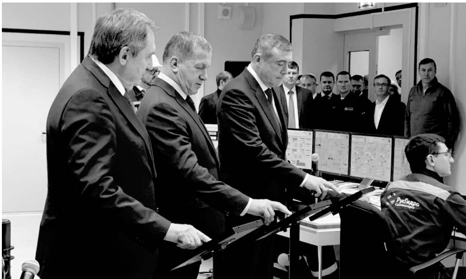
▲ 지난 25일(월) 토마리 구역 일린스코에 마을에 사할린 발전소-2 준공식이 있었다. 이 행사에 극동 연방구 대통령 전권대표 유리 트루트네브, 사할린 주지사 알레리 리마렌코, 주식회사 '루스기드로'의 대표이사 니콜라이 술기노브가 참석했다.