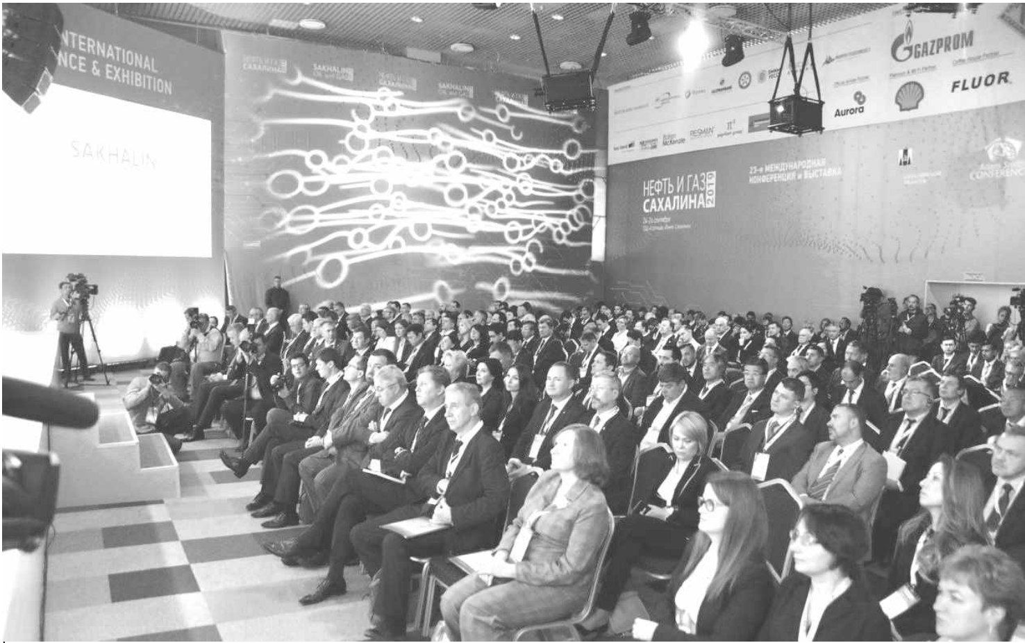
▲ 제 23차 <사할린 석유, 가스> 국제 컨퍼런스가 9월 24일부터 26일까지 유즈노사할린스크에서 개최되었다. 포럼 개막식은 <스틀리차>비즈니스센터에서 열렸다.