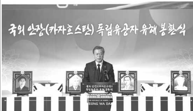
▲ 카자흐스탄을 국민 방문 중인 문 대통령은 4월 21일 오후 카자흐스탄 수도 누르술탄에서 현지에 안장돼 있던 계봉우·황운정 지사의 유해 봉환식을 주관했다. 추모사 하는 문재인 대통령

계봉우 지사, 황운정 지사와 배우자 모두 4위의 유해 대통령 전용기로 모셔