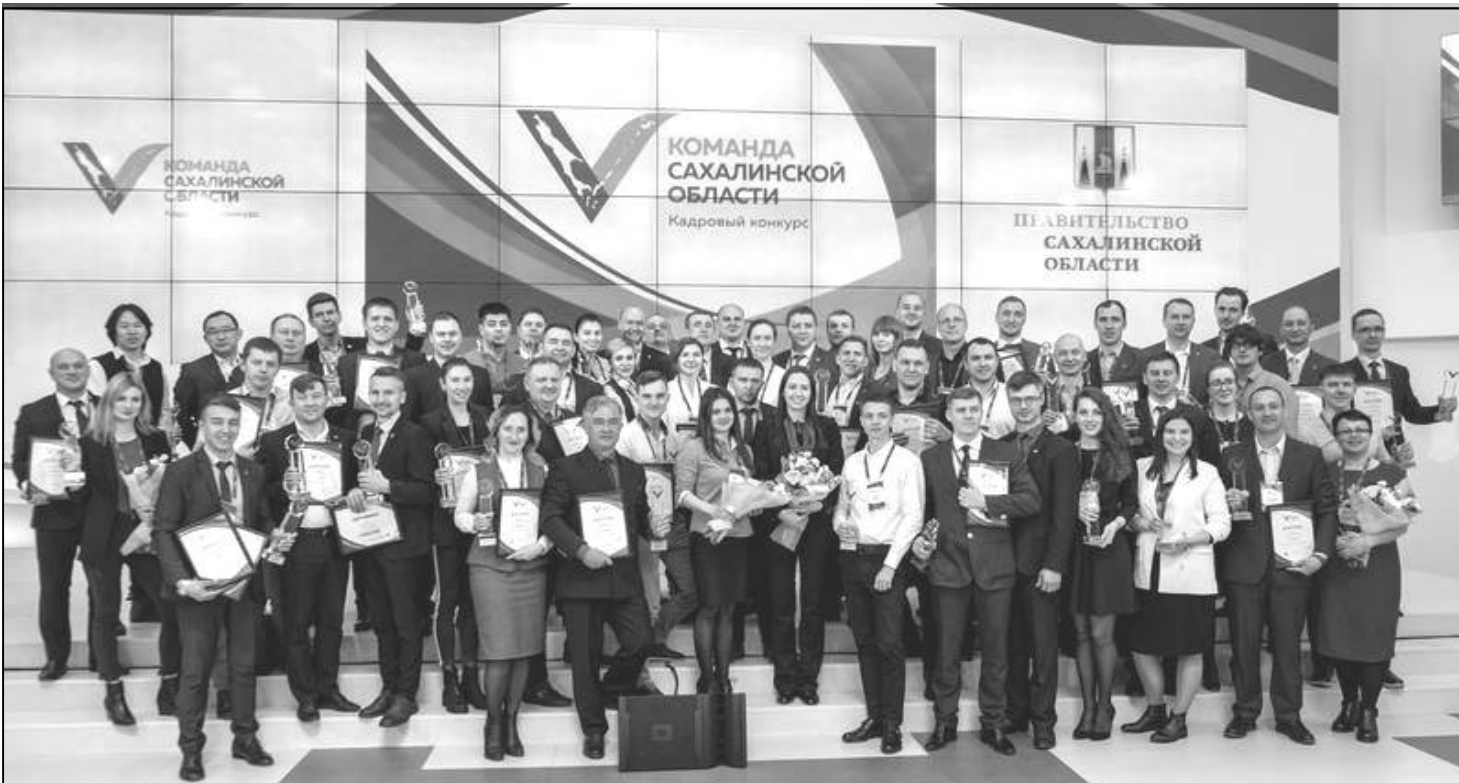
▲ 지난 22일(월) 사할린주정부 대강당에서 <사할린주 팀>인재발굴경연대회 우수자 발표·시상식이 있었다.