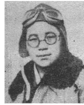
최초의 여성 비행사 권기옥.

판낙원은 김구의 어머니로도 유명하지만 1922년 상해(上海)로 건너가 대한민국 임시정부 요인들을 돕고 독립군 군자금을 마련해 '임정의 어머니'로 꼽힌다.