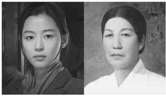
· 암살' 여 주인공 안옥윤 역을 맡은 배우 전지현(왼쪽)과 영화의 모티프가 된 독립지사 남자현. [케이퍼플럼 국립여성사 전시관]

영화 '암살' 모델 남자현, '임정 어머니' 판낙원을 만난다 소설 '상록수' '세 여자' 주인공과 해녀 항일투쟁사도 전시