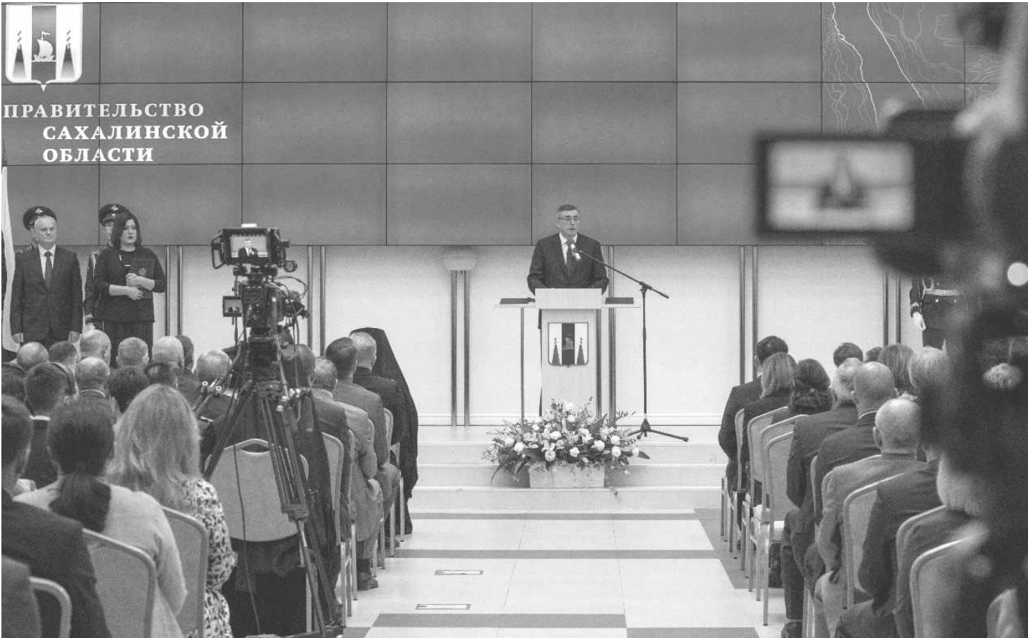
▲ 12일(목) 오후 2시 사할린주 정부 대강당에서 많은 인사들이 모인 가운데 알레리 이고레비츠 리마렌코 주지사의 취임식이 거행되었다.