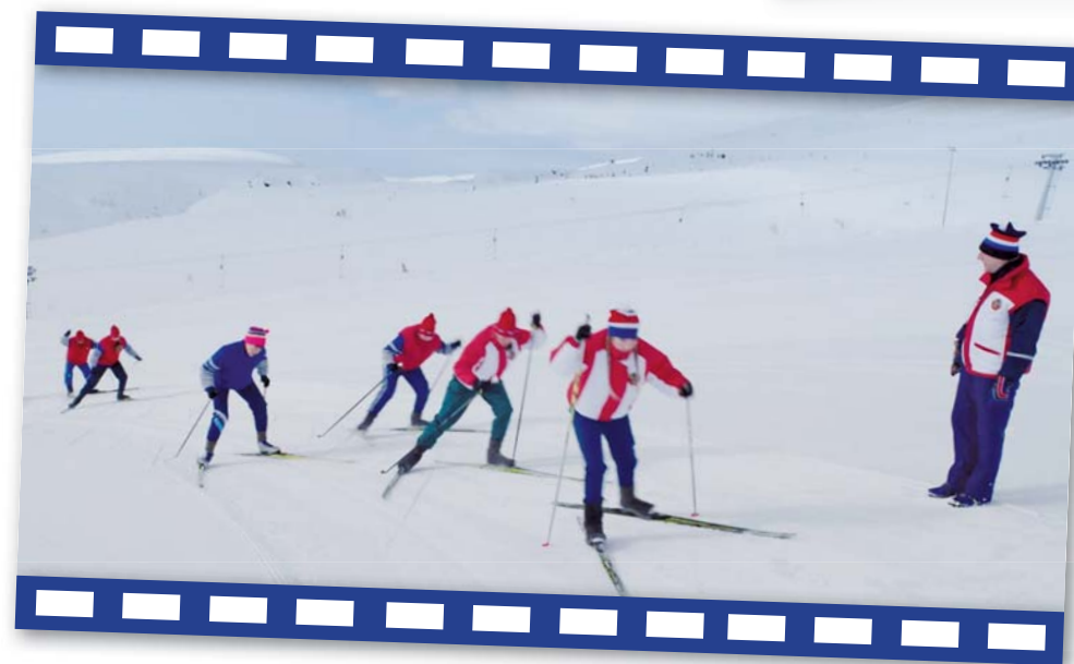
Кадр из фильма «Белый снег»

посвящен чемпионке мира, ныне президенту Федерации лыжных гонок России Елене Вяльбе, а второй – Герою Советского Союза Геннадии Зайцеву, командиру группы «Альфа» КГБ СССР. Чем объясните такой поворот к биографическому кино?