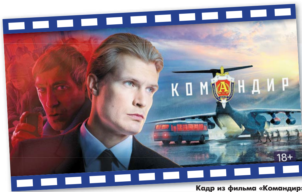
Кадр из фильма «Командир»

- Однако в дальнейшем от комедий вы перешли к серьезным проектам. Мы имеем в виду получившие признание зрителей и жюри различных конкурсов фильмы последних лет «Белый снег» (2020) и «Командир» (2024). Первый