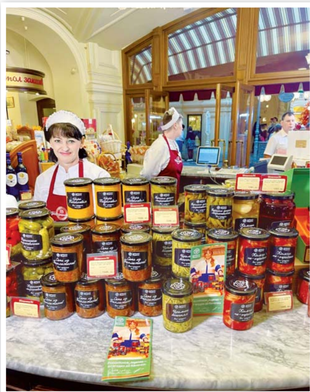
Кимчи уже на Красной площади в ГУМе!