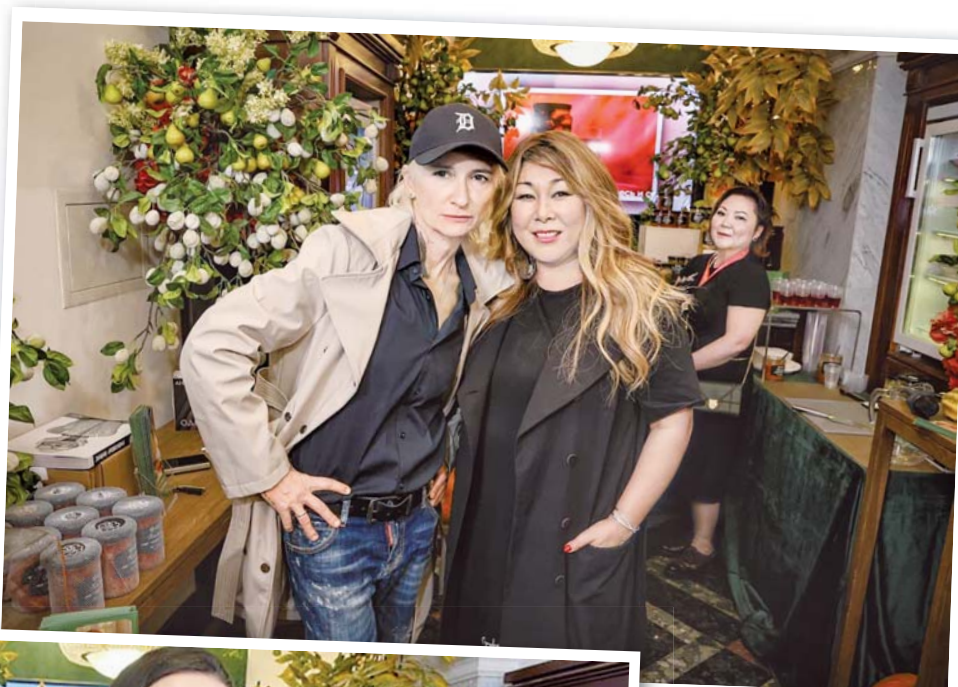
С композитором и певицей Дианой Арбениной

отлажено. А ещё добавила, что будущая невестка может не уметь готовить, поскольку всё приходит с опытом, тем более, что сейчас в интернете есть любой рецепт, главное — желание овладеть кулинарным мастерством. Звездная мама пообещала, что не будет мешаться на кухне, так как считает, что эта зона — камень преткновения всех хозяек, и неважно, молодые они или взрослые, каждая хозяйка ведёт по своему своё хозяйство, чтобы накормить своего любимого мужа тем, чем она считает нужным.