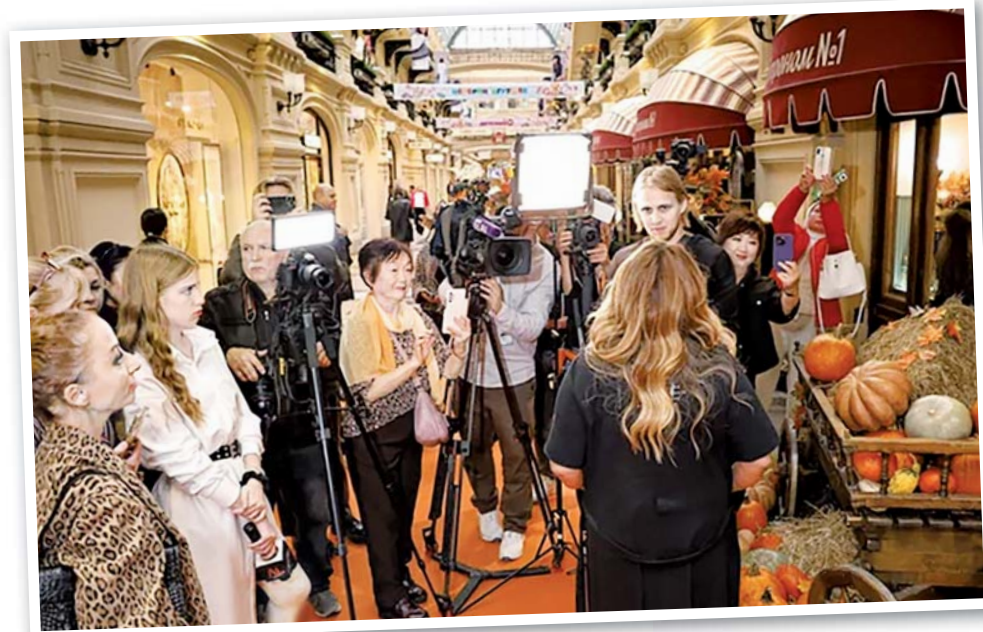
Интервью Аниты Цой для СМИ