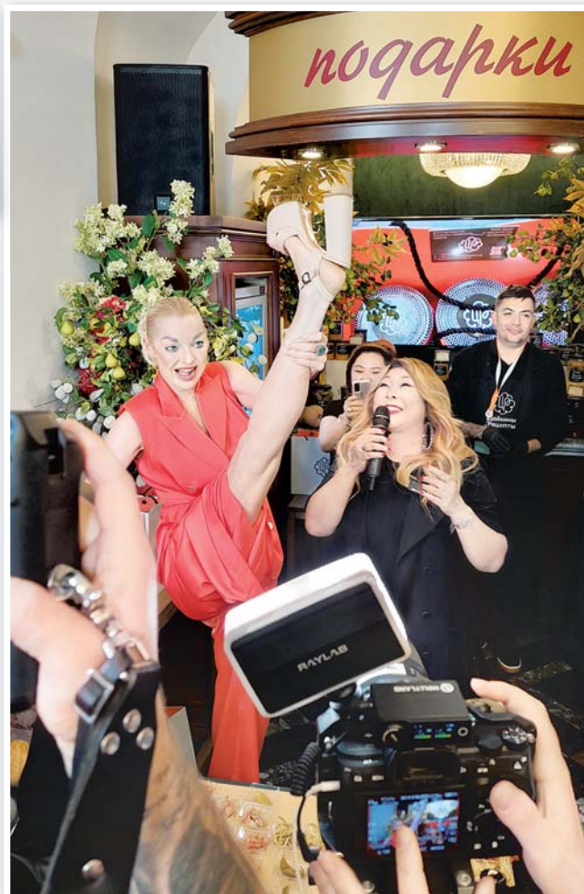
«Я могу всё!»: Анастасия Волочкова сделала впечатляющий вертикальный шпагат на вечеринке у Аниты Цой