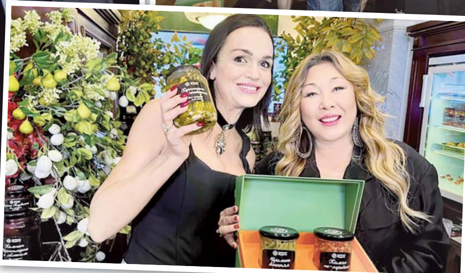
Славе — телеведущей, киноактрисе, исполнительнице песен от Аниты — особенно нравятся хрустящие огурчики