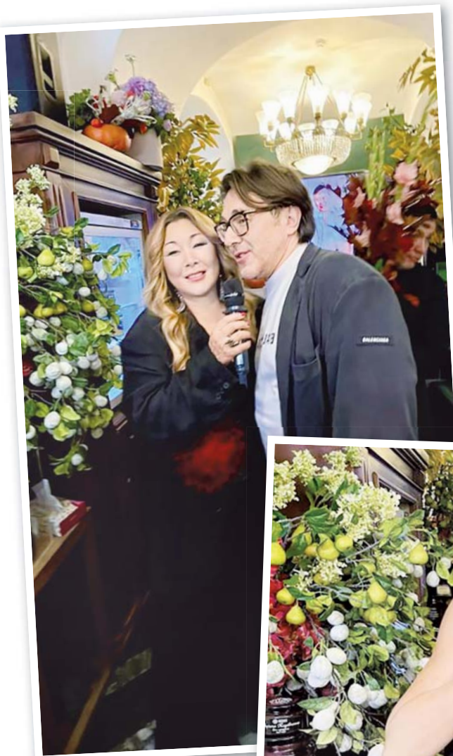
Впечатленный Андрей Малахов пригласил «ЦОЙКИНЫ РЕЦЕПТЫ» в свой родной город Апатиты