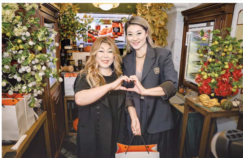
С телеведущей, депутатом Госдумы РФ Мариной Ким