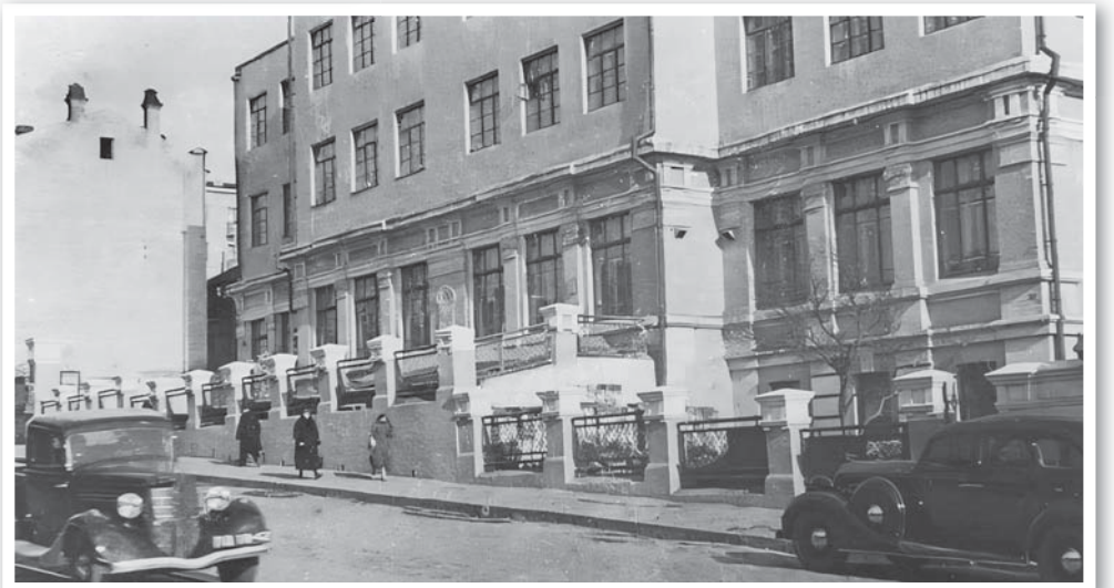
Корейский педагогический институт в 30-е годы

Переселение корейцев в Среднюю Азию в 1937 году