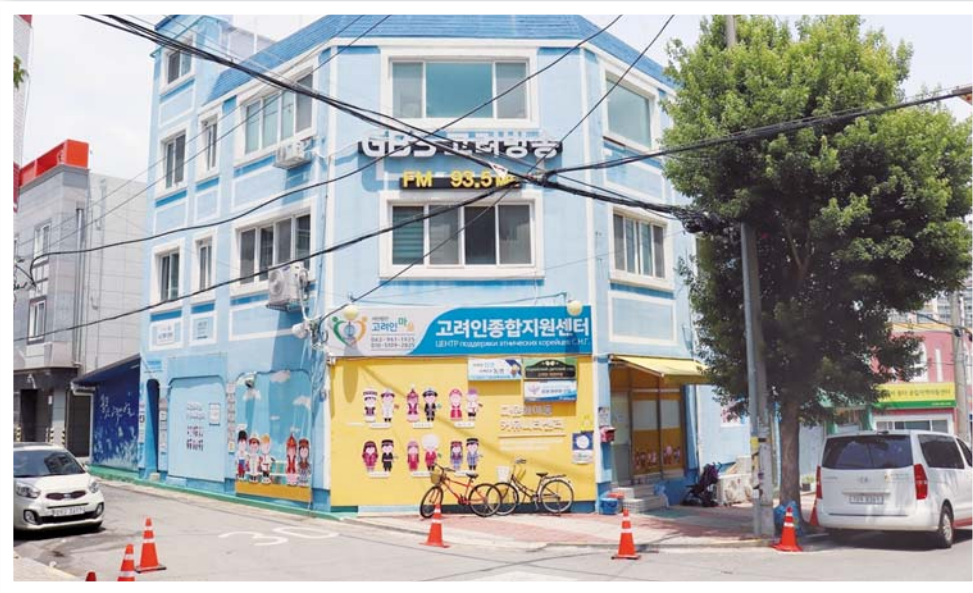
Здание центра корё-сарам в Кванчжу

Как бы это банально не звучало, но когда в далеком 2005 году я приехал в Южную Корею на четырехмесячную языковую стажировку, мне было довольно сложно привыкнуть к местной пищевой культуре. Конечно, в России я тоже частенько ел рис, кимчи и различные супы с соевой пастой и тофу, но делать это каждый день в Высшем колледже корееведения ДВГУ, конечно, не учили. Селедка, хлеб, борщ и даже пельмени – все это из чего-то обычного и повседневного внешне стало для меня гастрономическими изысками, которые можно было отведать лишь на знаменитом Тондэмуне.