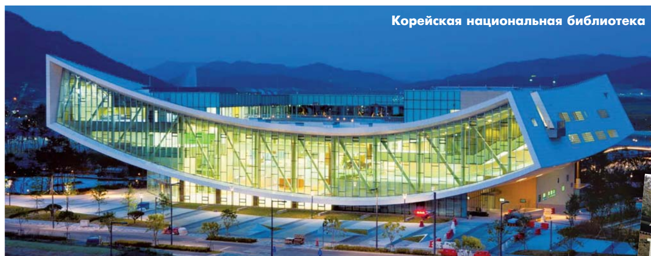
Корейская национальная библиотека

В число объектов must-see включена и ультрасовременная библиотека «Поле звезд» (Пель мадан, англ. Starfield), открытая в 2017 году в Международном выставоч-