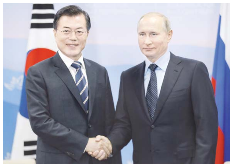
2018 год. Встреча с президентом России В.В. Путиным

Встреча русскоязычных корейцев с 19-м по счету президентом Республики Корея Мун Чжэ Ином, который возглавлял страну в период с 2017 по 2022 год, состоявшая недавно, имеет особый смысл.