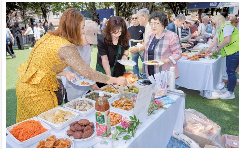
Неповторимая кухня русских корейцев

Однако наиболее яркой общей чертой всех корёин маыль является наличие здесь уже упомянутых этнических бизнесов – кафе, магазинов и других заведений, а также различных коммерческих компаний, ока-