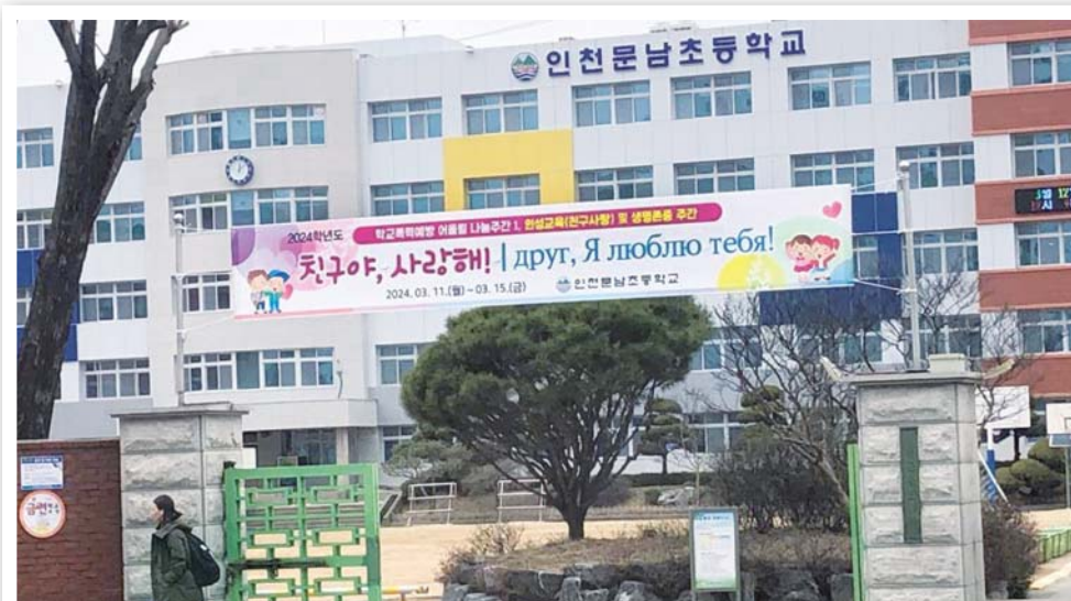
Школа Муннам в Инчхоне

Таким образом, корёин маыль – это уникальные для Южной Кореи сообщества русскоязычных мигрантов, этническим ядром которых являются корё-сарам. Родившийся стихийно около 15 лет назад феномен продолжает развиваться и уже сейчас стал предметом пристального интереса со стороны южнокорейских учёных и чиновников. Так, мэрия города Чечон (провинция Северная Чхунчхон) в 2023 году предприняла попытку создать собственную корёин маыль для решения проблемы недостатка трудовых ресурсов для местных предприятий. Пока говорить о результатах эксперимента рано, но сам по себе проект пытается решить упомянутый выше вопрос интеграции корё-сарам и членов их семей в южнокорейский социум путём реализации программ культурной и языковой адаптации. И такой подход мне кажется правильным, так как важнейшей задачей, которая сейчас стоит перед южнокорейскими властями и самими сообществами корёин маыль, – это не допустить их геттоизации и превращения в районы трущоб, откуда бежит местное население.