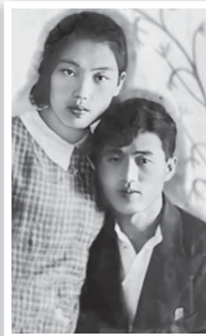
Первые Лю в Приморье