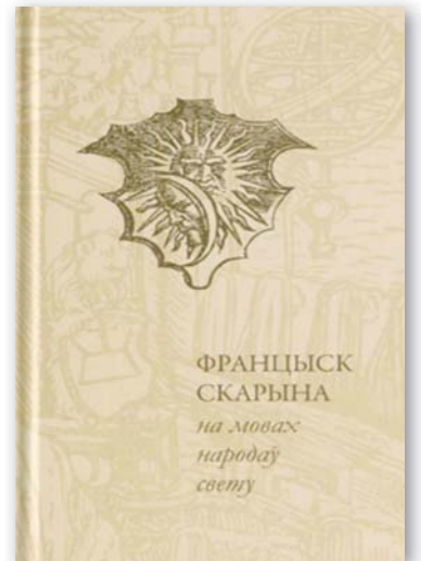
◆벨라루시아어 서적출판 500주년을 기념하여 출간된 『세계의 언어들로 번역된 프란치스크 스카리나』(벨라루시아 민스크 2016) 김병학 시인이 책내용의 한국어 번역을 맡았다.

탄 현대 9인 시인의 시를 번역하여 『초원의 페이지를 넘기며』를 출간했다.