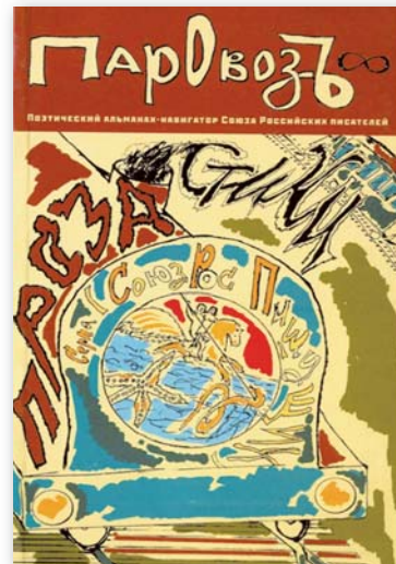
◆김병학 시인의 시편이 실린 러시아어 문예잡지 『증기기관차』(모스크바, 2014)