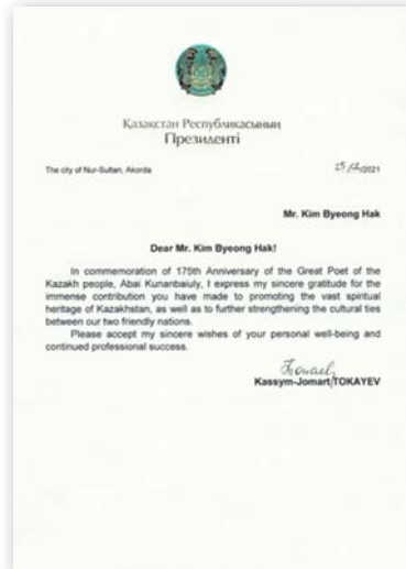
◆카심조마르트 토크아예프 카자흐스탄 대통령이 김병학 관장에게 수여한 감사장(2021년 2월 25일)

그리하여 2010년 고려인 시인 리 스파니슬라브 씨의 시편을 번역해 『모브르마을에 대한 추억』이라는 책을 출판한 것을 필두로 카자흐스탄의 천재 시인 아바이의 시 100편을 우리말로 옮겨 『황금천막에서 부르는 노래』를 펴낸 데 이어 같은 해 말에는 카자흐스