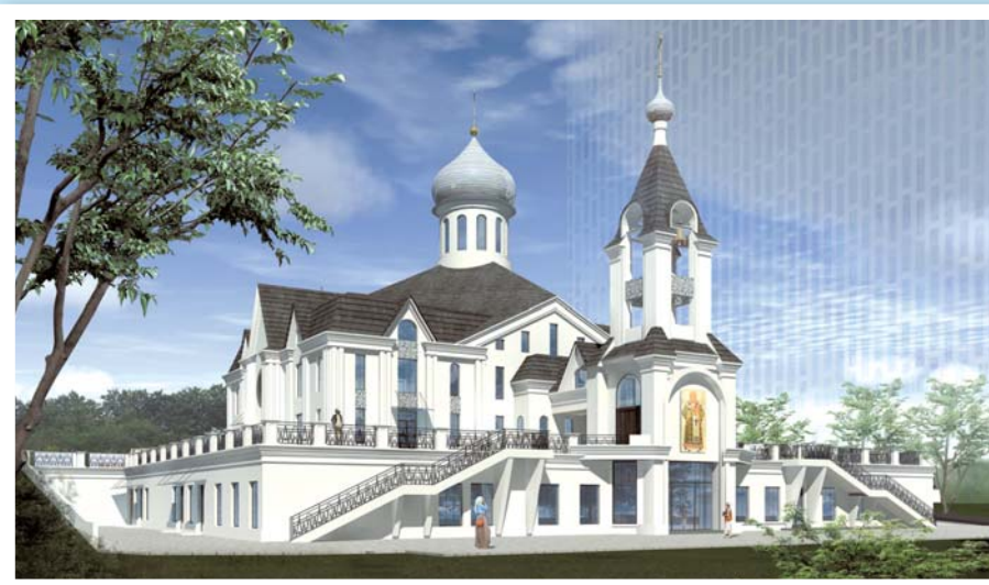
МУЗЕЙ, ШКОЛА, КЛУБ ПОД КУПОЛОМ ХРАМА стр. 10