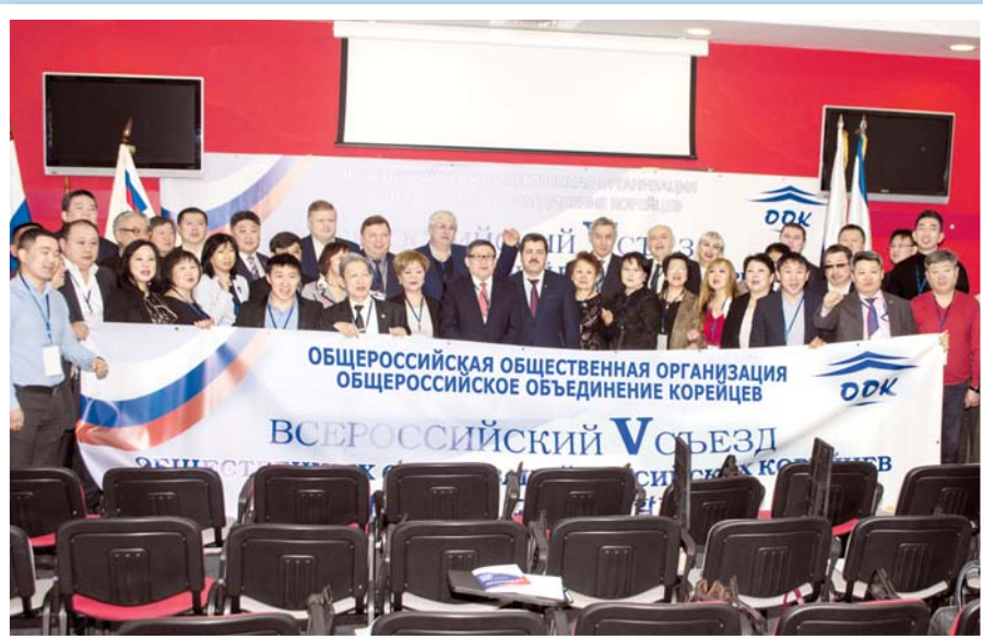
СМОТРИТЕ, КТО ПРИШЕЛ! стр. 2, 5