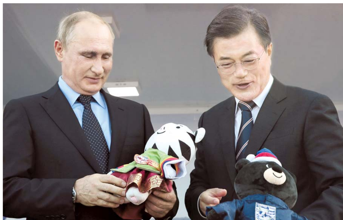
У России и Кореи всегда находились общие интересы

После Крыма исчезли скинхеды. Крымская весна показала, что принадлежность к русскому миру определяется не разрезом глаз, цветом кожи или волос, и даже не православной верой, а мировоззрением, ценностями, отношением к истории страны, к Великой Отечественной войне. Слово патриотизм в России приобрел первоначальный смысл. Патриотизм по Путину является главной объединяющей национальной идеей в России.