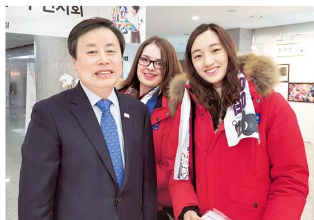
Сотрудники Корейского Культурного центра с министром культуры, спорта и туризма Республики Корея господином То Чжон Хван