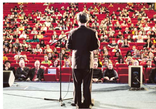
Чрезвычайный и Полномочный Посол Республики Корея в РФ У Юн Гын на открытии фестиваля корейского спортивного кино 1 февраля