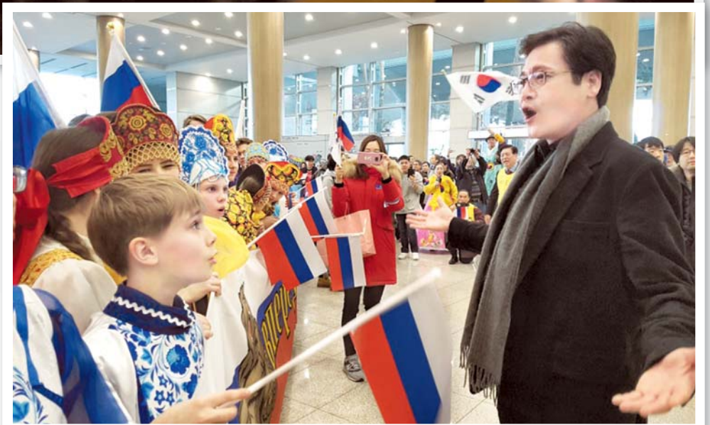
Корейский оперный исполнитель (бас) Ван Нам вместе с болельщиками исполняет Гимн России в международном аэропорту Инчхон

Чрезвычайный и Полномочный Посол Республики Корея в РФ в своём выступлении перед гостями пожелал удачи сборной Кореи и олимпийским атлетам из России и обратил внимание на важность поддержки болельщиков.