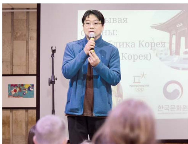
Директор Культурного центра Посольства Республики Корея в РФ Ким Иль Хван на мероприятии 10 февраля

Весной в библиотеке откроется уголок корейской литературы, и это даст шанс маленьким любознательным посетителям открыть мир страны утренней свежести.