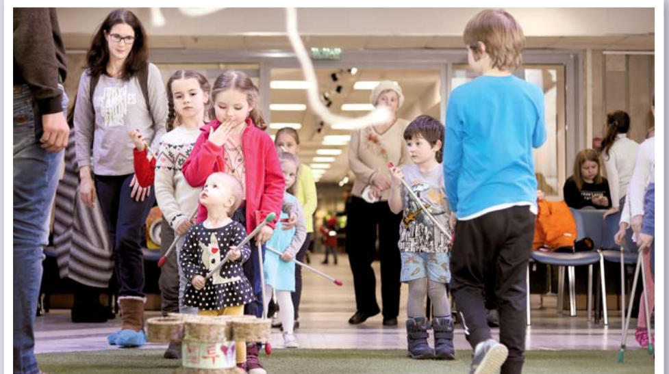
Дети учатся играть в «тухо»

После этого гости посмотрели прямую трансляцию церемонии открытия Олимпийских игр.