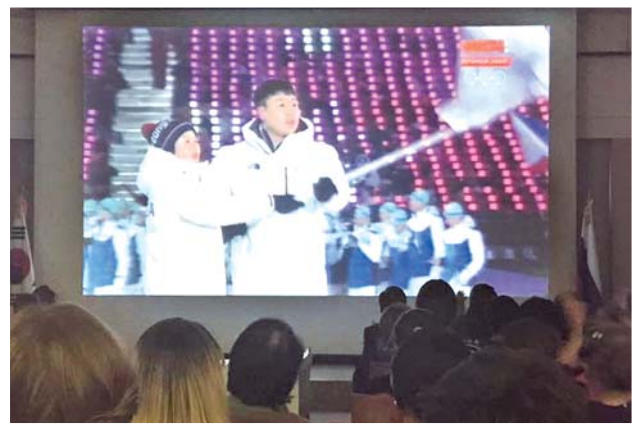
Просмотр прямой трансляции Церемония Открытия Олимпийских игр (На парад Республика Корея и КНДР выходят под одним флагом)

В это время в Москве 9 февраля был организован приём в Посольстве Респу-