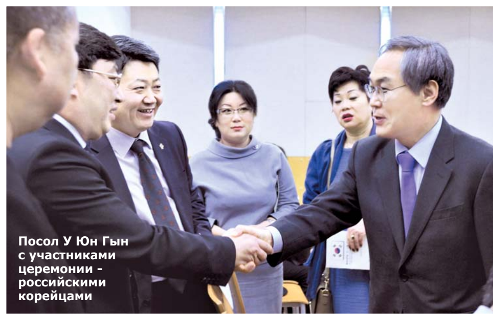
Посол У Юн Гын с участниками церемонии – российскими корейцами

(Продолжение темы – стр. 5)