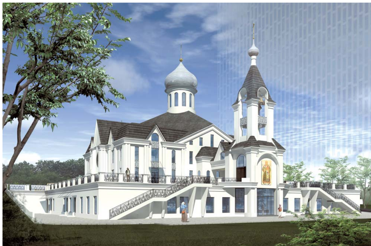
Центр будет примыкать многоэтажному зданию южнокорейского бизнес-центра «Лотте»

И все-таки многое задуманное не является заботой исключительно славяно-корейской