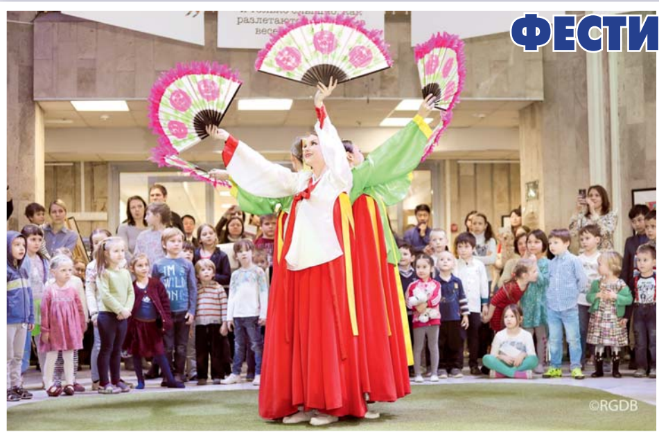
Традиционный корейский танец с веерами «Бучхе Чхум» в исполнении ансамбля корейского национального танца «Небесная Птица»

Всего за три дня фестиваля были продемонстрированы четыре картины: фильм «Взлёт 2», «Взлёт», документальная лента «Запах зимы» и художественный фильм «Как один». Бесплатные показы посетили более 1500 зрителей.