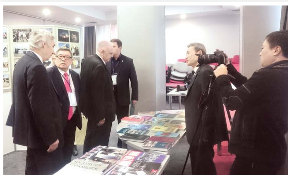
Издательское направление – один из приоритетов ООК