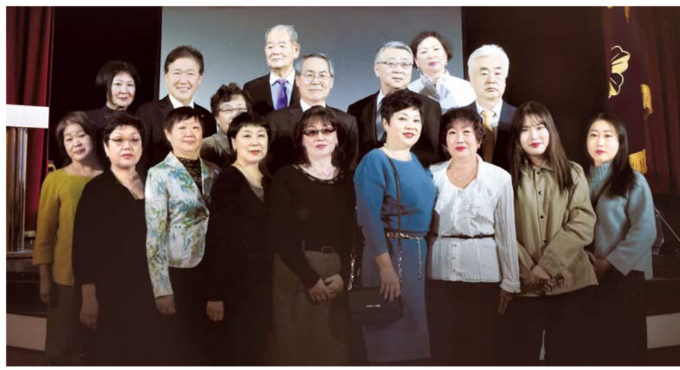
Снимок на память с российскими корейцами. Москва, 28 декабря 2017 г.