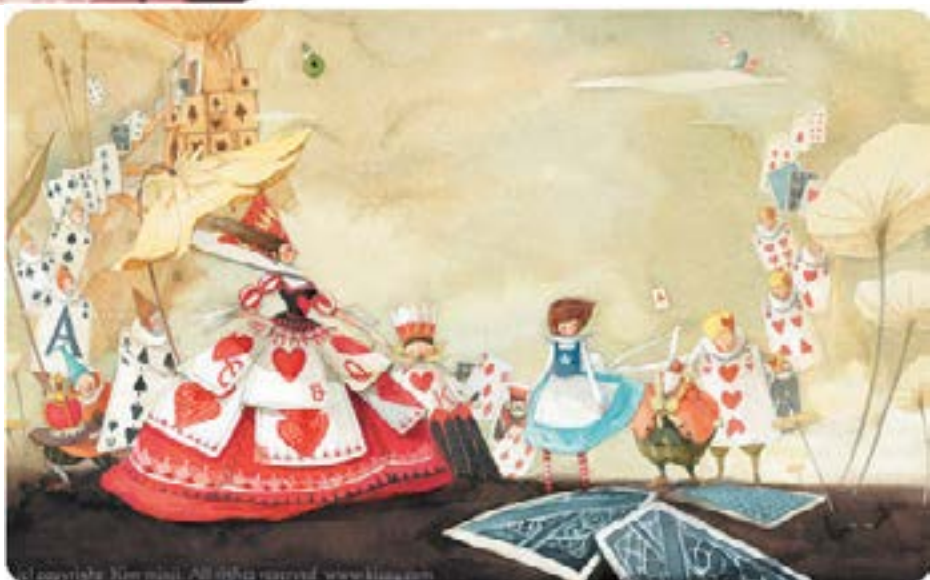
Иллюстрации к книге "Алиса в стране чудес"