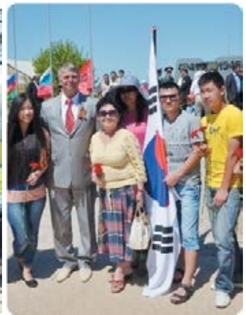
На открытии памятника в честь погибших воинов во Второй мировой войне