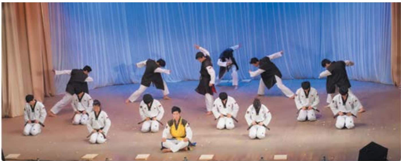
Команда по показательным выступлениям Kukkiwon Team (Республика Корея)

А мы приглашаем всех на XIX Всеукраинский фестиваль корейской культуры и искусств, который состоится в городе Днепрпетровске. До скорой встречи!