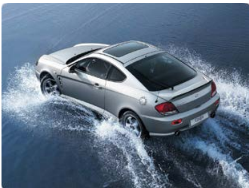
Hyundai Coupe Tiburon