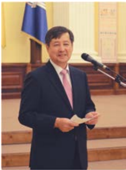
Чрезвычайный и Полномочный Посол Республики Корея в Украине Ким Ын-Цжун

3 октября Республика Корея ежегодно отмечает один из главных государственных праздников – День основания нации. Праздник приурочен к образованию первого государства корейской нации в 2333 году до нашей эры легендарным королем-богом Тангун Вангом.