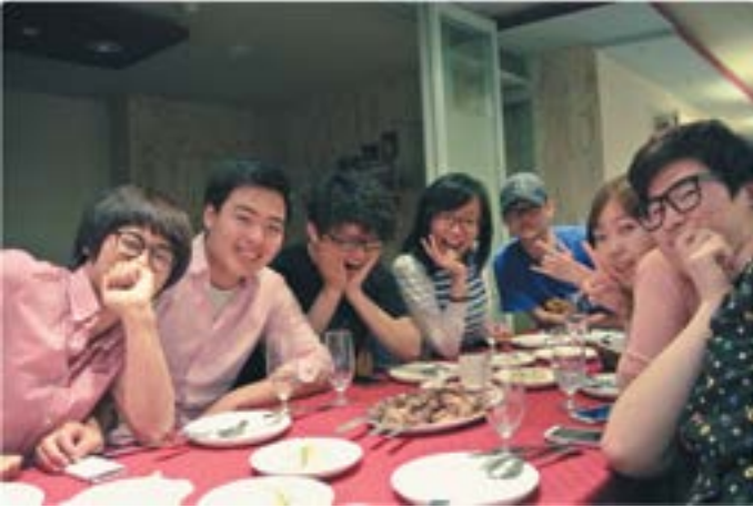
Поход с корейскими друзьями в русский ресторан в Сеуле

Корея – мононациональная страна, и если в Америке принцип «всех под одну гребёнку» подобен греху, то в Корее – это как раз основное правило построения общества. «Не выделяться и быть таким, как все» – вот принцип, которую следуют практически все корейцы. «Все заказали гимчхичиге, а почему ты выбрал бибимпаб?» – вот фраза, представляющая собой эталон корейского менталитета.