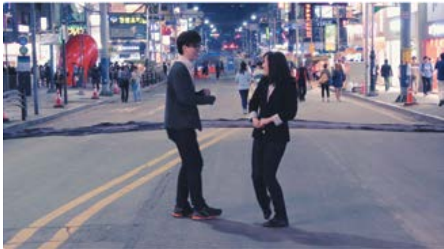
Съемки видео на конкурс "Мой лучший корейский друг"

С первых моментов совместной игры на барабанах все границы моментально стёрлись, пропали «наши» и «не наши», «они» и «мы».