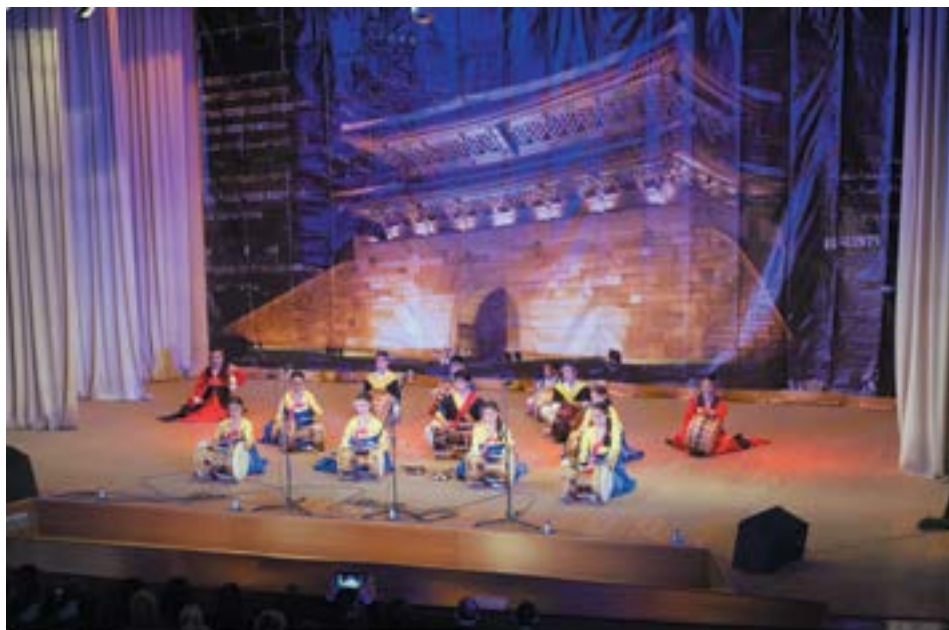
Ансамбль корейских народных инструментов «Самульнори»