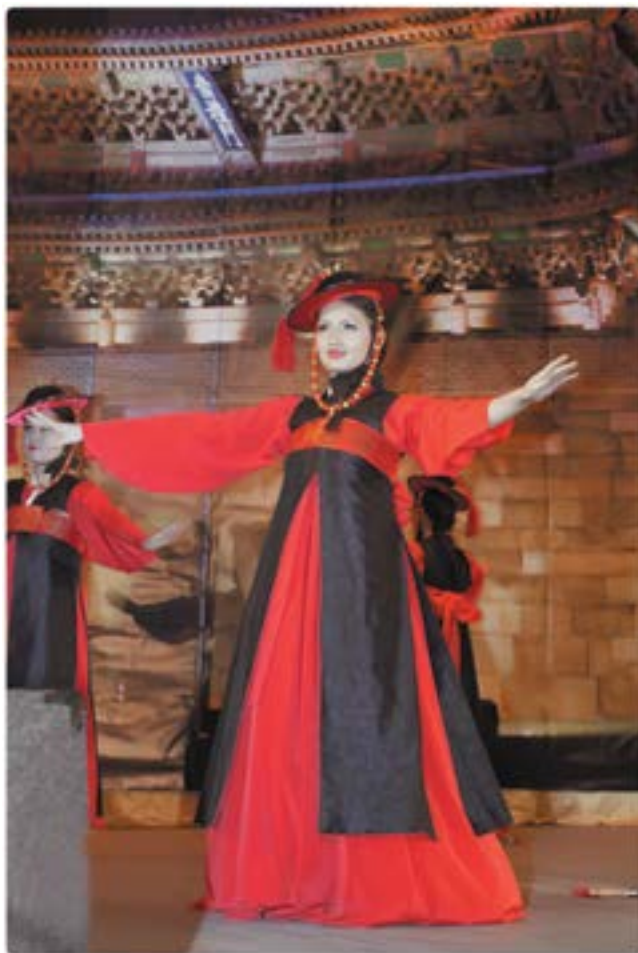
Ансамбль традиционных корейских танцев "Торади"