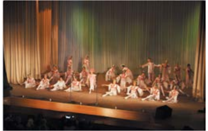
Ансамбль "Конфетти" с приветственной композицией "Квітка-душа"