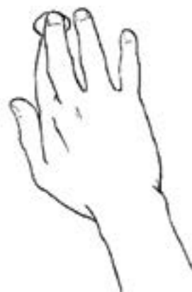
Так держат камень согласно этикету Го. Два вытянутых пальца с зажатым камнем повторяют классическую форму фехтовального комплекса