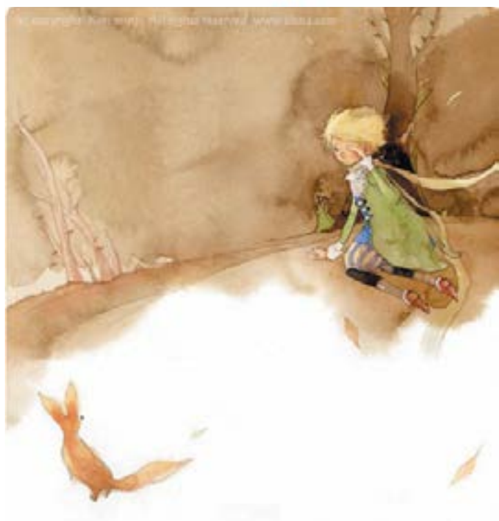
Иллюстрации к книге "Маленький принц"