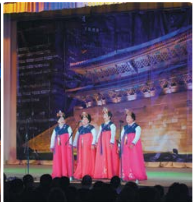
Гости из Москвы – ансамбль "Дэхан"