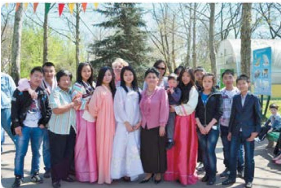
На празднике Дня Земли