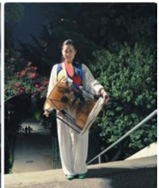
Выступление пхунмоль с корейскими друзьями