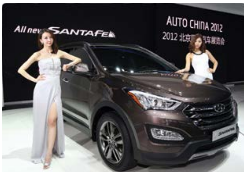
Hyundai Santa Fe