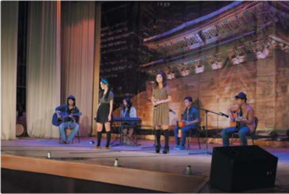
Инструментальная группа из Днепропетровска