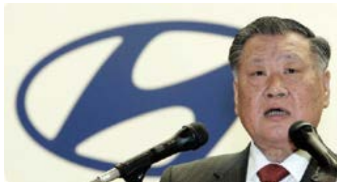
Chung Mong Koo