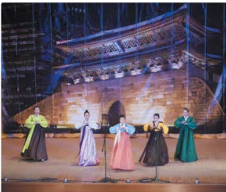
Традиционный корейский поклон