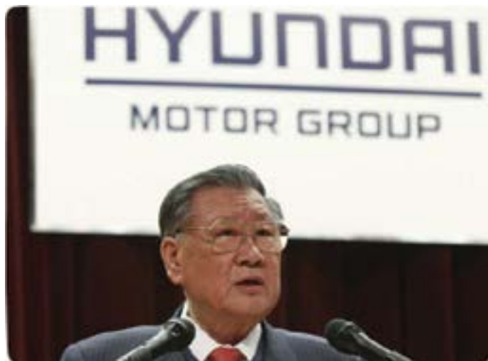
Chung Ju Yung

До 70-х годов экономика Кореи становилась всё крепче, и правительство объявило о начале ударного развития тяжелой промышленности. К борьбе за первенство присоединилась и компания Hyundai, которая в то время уже могла рассчитывать на финансовую поддержку и гарантии со стороны властей. В результате в последующие годы корейская империя сделала страну второй кораблестроительной державой мира и на вырученные средства продолжала активное строительство автопредприятий и заводов по изготовлению электроники, что привело к появлению подразделений Hyundai Motor Corp. и Hyundai Electronics.