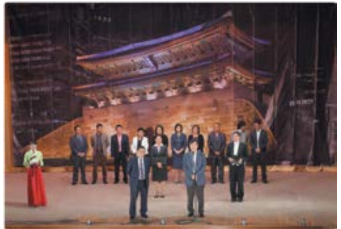
Кан Ден Сик и Чрезвычайный и Полномочный Посол Республики Корея в Украине Ким Ын-Цжун