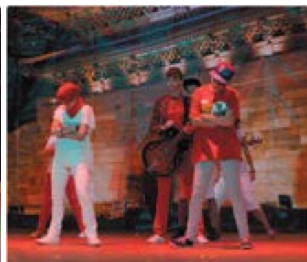
Группа «Purple Line»

Ну а гран-при досталось ансамблю корейских народных инструментов «Самульнори» из Киева, которые устроили на сцене настоящее шоу, представив публике традиционную корейскую игру на барабанах, увеличив количество участников с традиционных четырех до тринадцати! Так, перед зрителями играли одновременно тринадцать барабанщиков, создавая непередаваемую и торжественную атмосферу.