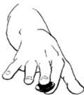
Правильная постановка руки, направляющей камень