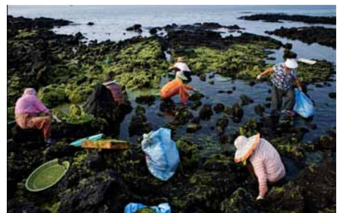
Иногда хэнью собирают добычу на берегу, которую выбросило бурное море накануне