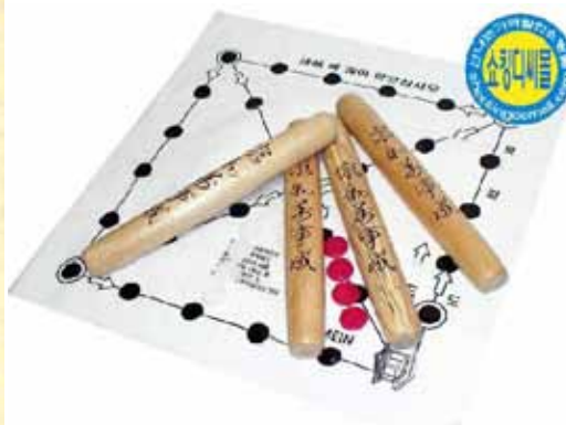
Поле для игры в ют