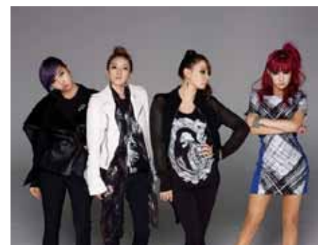
2NE1 To Aynone