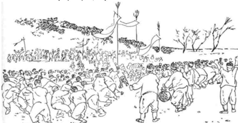
Перетягивание каната (чутьтариги)

В новогодней обрядности наблюдались элементы шутки, игры. На острове Ыйч-