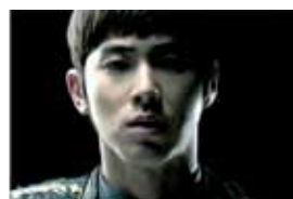
3. Юнхо из TVXQ