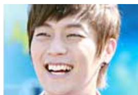
7. Ду Чжун, лидер из B2ST