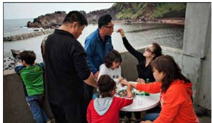
Туристы пробуют блюда из морепродуктов в простеньком ресторанчике в доме одной из хэнью