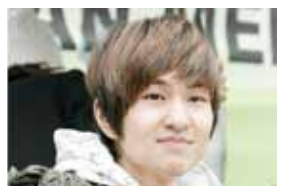
6. Онью из SHINee