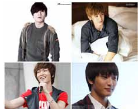
Знаменитости, обладающие группой крови O

Люди с группой крови AB, имеют прекрасную интуицию, стремятся объять необъятное, предпочитают сохранять свою собственную территорию. Безусловно, что люди с AB-кровью почти всегда попадают в число наиболее интересных личностей.