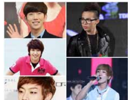
Знаменитости, обладающие группой крови B