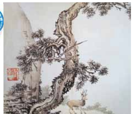
Сосна - символ долголетия