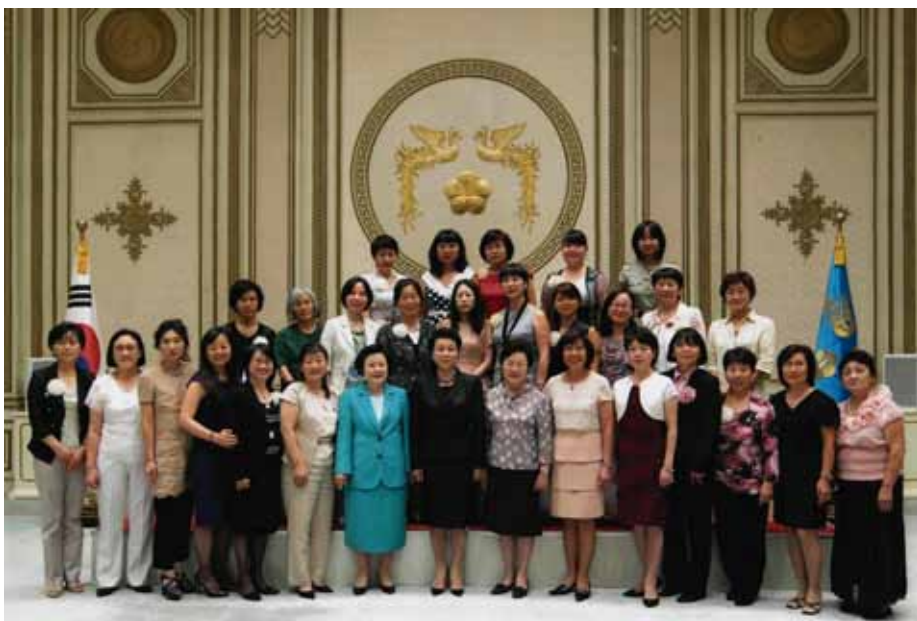
Форум женщин-кореенок в г. Ульсан, в центре - жена президента

Конечно же, я понимаю, что молодежь моего поколения почти полностью отличается от нынешней. Это отличие и радует и одновременно несколько беспокоит меня как мать и бабушку. Радует их стремление состояться во всех сферах жизни (учебе, бизнесе, спорте, культуре и т.д.), а беспокоит их духовное состояние, т.е. извечные внутрен-