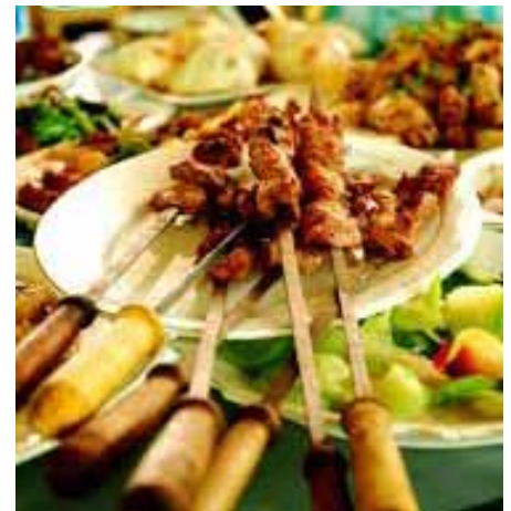
대표적인 산적, 파산적

외국 음식에도 꼬챙이에 고기와 여러 가지 채소를 함께 꽂아 구워 먹는 음식이 있다. 동남아시아 여러 국가에서 즐겨 먹는 사뎀(Satay), 터키의 케밥(Kebab) 등이 그것이다. 요즈음 한국에서는 각각의 재료에 간단히 조미를 하여 꼬챙이에 꽂아 구운 산적이 외국의 핑거 푸드처럼 뷔페 음식으로도 애용되고 있다.