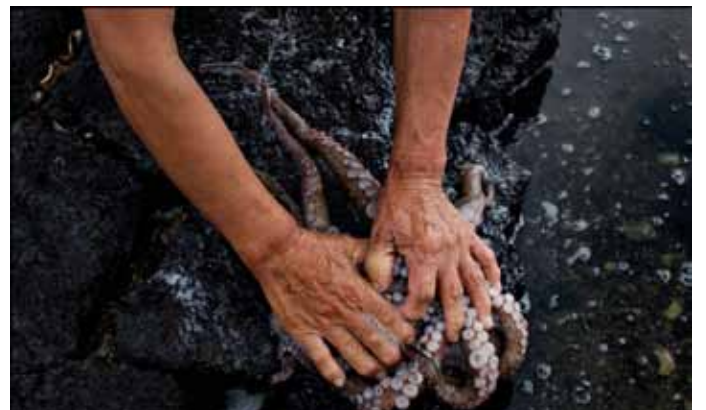
Вот так полощут осьминога