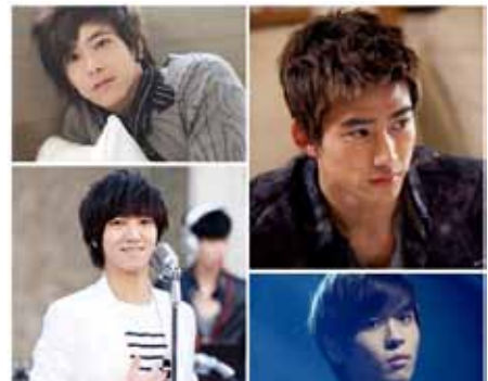
Знаменитости, обладающие группой крови AB

Кстати! Наступил Год Дракона, а из звезд этого года у нас ТхэЁн и НикКун из 2PM и G-Dragon и ТхэЯн из Big Bang.