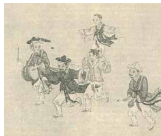
Кисан. Крестьянский танец нонак