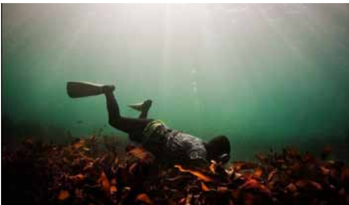
На морском дне в поисках моллюсков