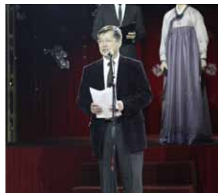
Чрезвычайный и Полномочный Посол Республики Корея Ким Ын-Цжун