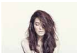
9. Кахи из After School