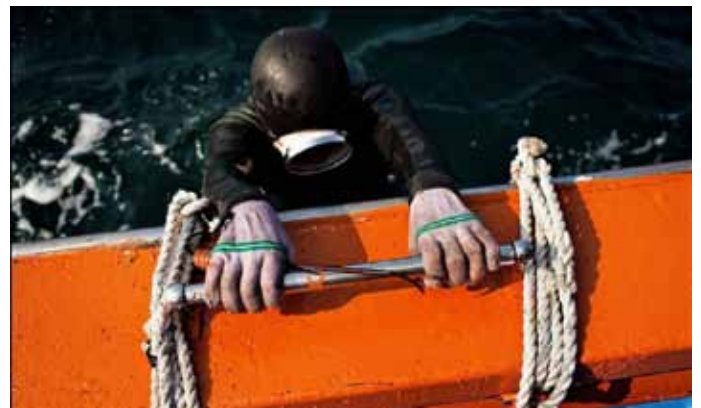
Возвращение на борт