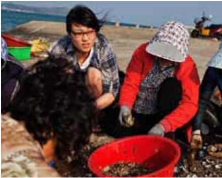
Иногда бабушкам помогают внучки