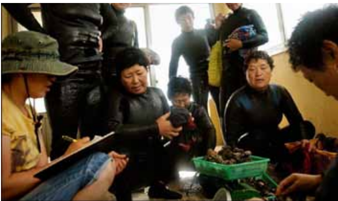
Улов нужно взвесить