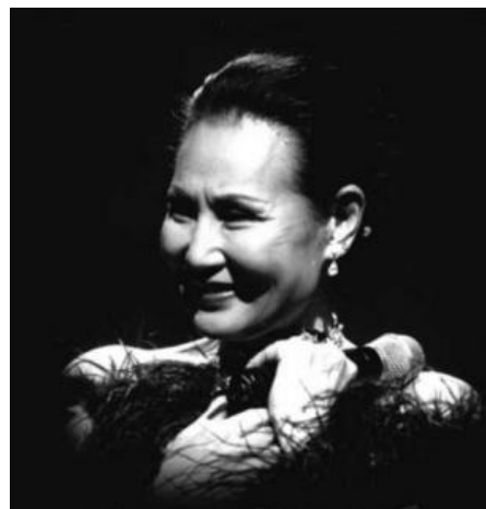
Ким Хе Чжа (Пэтти Ким)

Сегодня музыканты оттачивают свое мастерство в гаражах или же в зданиях типа СМ энт., раньше все начиналось с военных баз США. Оттуда берет свои истоки и корейский рок.