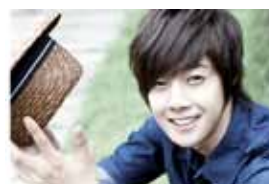
4. Ким Хён Чжун из SS501