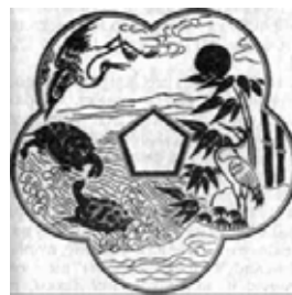
Символы долголетия (черепаха, аист, бамбук, солнце, горы и море). Фрагмент орнамента, украшающего потолок королевского дворца

16-й день первого месяца считался наиболее опасным, так как особенно «возрастала» активность злых сил и демонов, поэтому в этот день избегали выходить из дома. В первые новогодние дни на женщин ложились основные заботы о здоровье и счастье детей. Естественное желание каждой женщины видеть своих детей крепкими и здоровыми нередко приводило к исполнению старинных обрядов, направленных на «очищение от бедствий» или «очищение от злых духов». С этой целью мальчики и девочки под руководством своих матерей или бабушек изготовляли особые деревянные сосуды в форме тыквы горлянки и, перевязав их нитью, выбрасывали в полночь на улицу. Из бумаги они вырезали изображение ноги, надписывали на ней свои имя, фамилию и год рождения, а затем зацепляли эти листики в палочки из кустарника хаги и втыкали