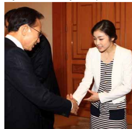
Президент Южной Кореи Ли Мён Бак пожимает руку чемпионке Ким Ё На

Сонбэ – так обращаются к студентам, которые на один-два курса старше, или к старшим коллегам по работе. Хубэ, соответ-