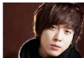
8. Ён Хва из CNBlue