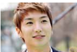
5. Ли Тук из Super Junior