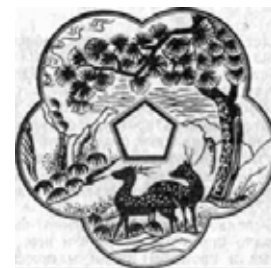
Символы долголетия (олени, сосна, бамбук, горы, море). Фрагмент орнамента, украшающего потолок королевского дворца

их в крышу. Иногда вырезали из бумаги месяц и луну или рисовали на бумаге человеческую фигуру; подписав свое имя и фамилию, они завертывали в бумагу монету и немного вареного риса и выбрасывали все это на перекресток дорог или в реку.