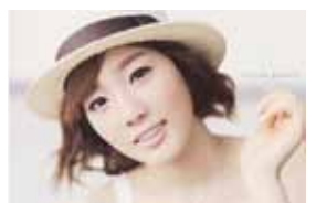
1. Girls' Generation