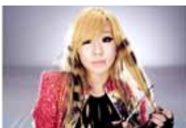
10-е место. 2NE1

G-Dragon – это, по сути дела, лидер группы соло-артистов, которому действительно пришлось бы очень трудно, если