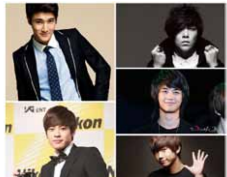
Знаменитости, обладающие группой крови B