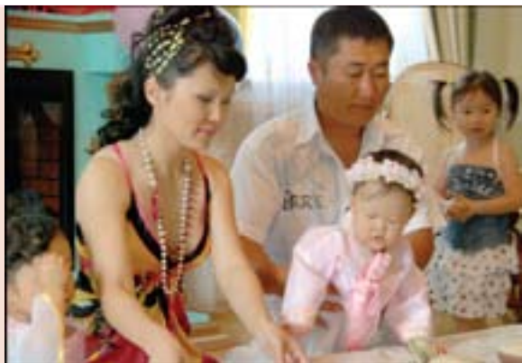
Виновица торжества с родителями

рит, не жалеет, что когда-то принял решение приехать сюда, ведь сегод-