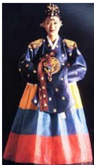
Одежда представительниц королевской семьи

Таким образом, красный цвет приобрёл статус королевского и прочно закрепился в мышлении людей как цвет, символизирующий лидерство, роскошь и власть.