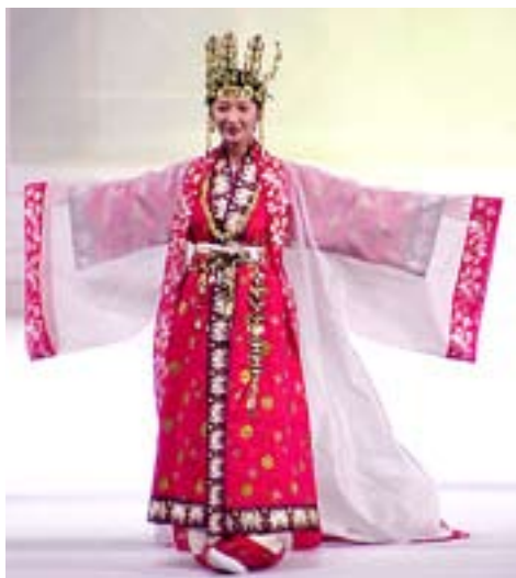
Одежда королевы эпохи Силла