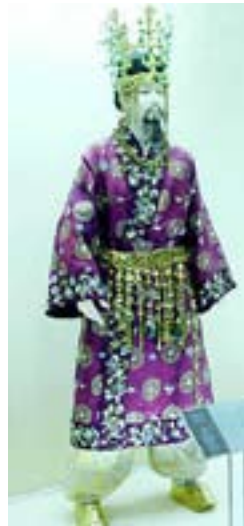
Церемониальная одежда короля Корё