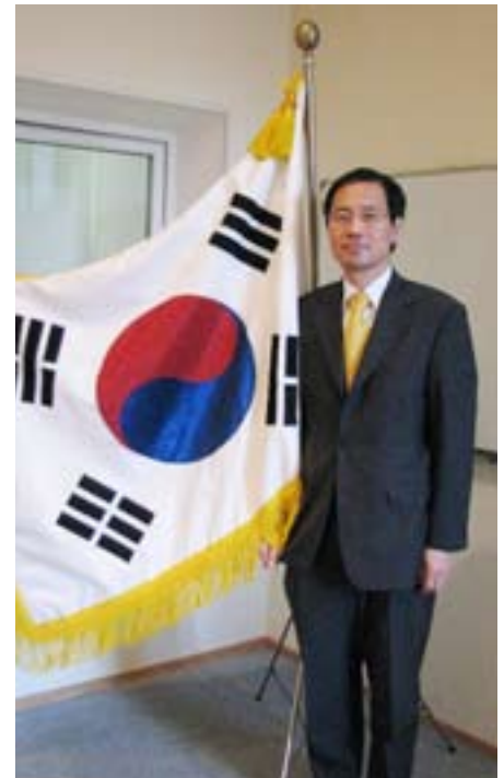
Пак Ро Бек, Чрезвычайный и Полномочный Посол Республики Корея в Украине

Несмотря на всеобщую обеспокоенность, украинцы были решительно настроены укрепить свое государство, поддержать национальную идею и расширить сотрудничество