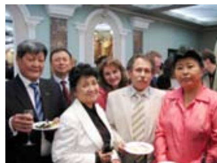
Главы региональных обществ корейцев Украины