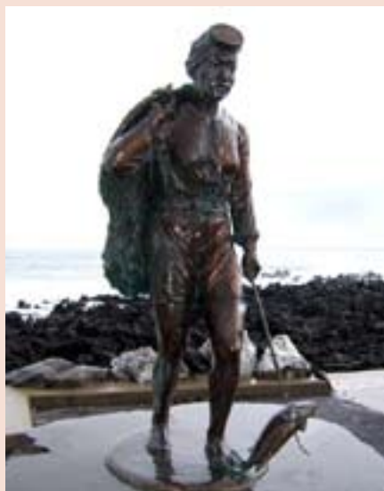
Памятник хэне (ныряльщицам)

Туристический комплекс построен на побережье среди утесов, водопадов, живописных долин и садов. Рядом расположились мно-