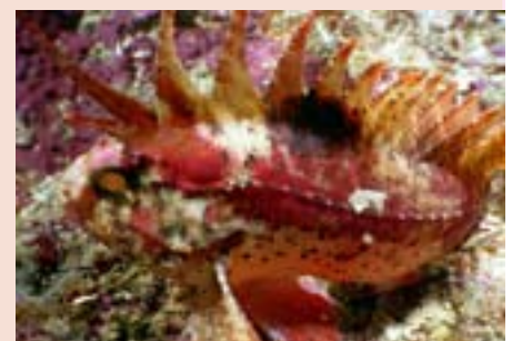
Осень под водой