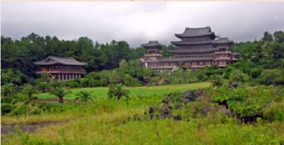
Храм древней империи на Чеджудо