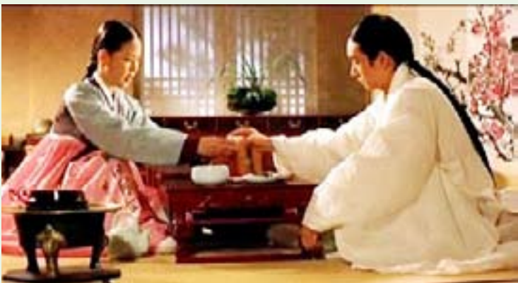
Мон Нён и Чунхян. Кадры из фильма «Сказание о Чунхян» (Chunhyang) режиссера Им Гвон Тхэк, 2000 г.

Эта старинная повесть стала излюбленным сюжетом музыкального представления пхансори. Сама структура легенды основана на текстах и ритмах песен пхансори.