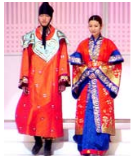
Одежда членов королевской семьи эпохи Трёх Королевств