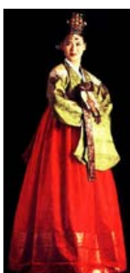
Одежда принцессы эпохи Корё