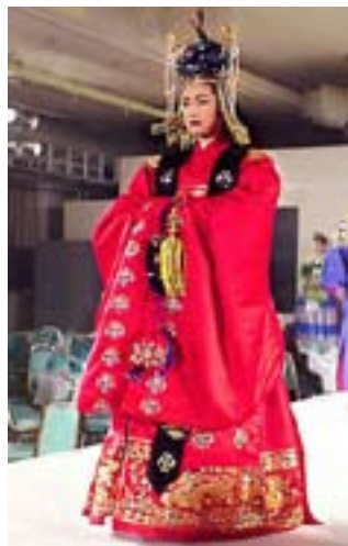
Церемониальный костюм королевы эпохи Чосон

На традиционной свадьбе невеста одевала вонсам (свободный «халат»,