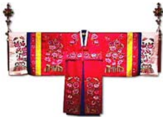
Одежда Короля эпохи Силла

Wonsam (вонсам) — это верхняя часть церемониального ханбок ,