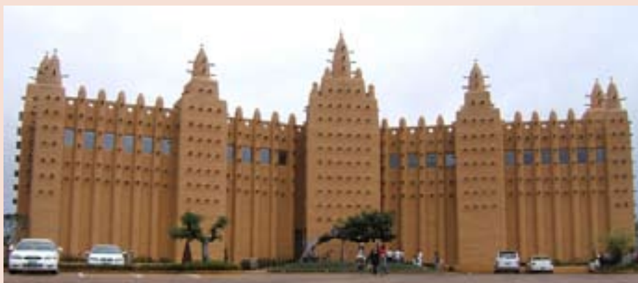
Музей Африки на острове

гочисленные пляжи, а также самые роскошные гостиницы Кореи. Здесь проходили съемки многих известных корейских фильмов, а, кроме того, курорт Чунмун — излюбленное место отдыха корейских знаменитостей.