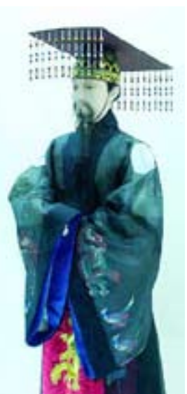
Одежда знати эпохи Корё