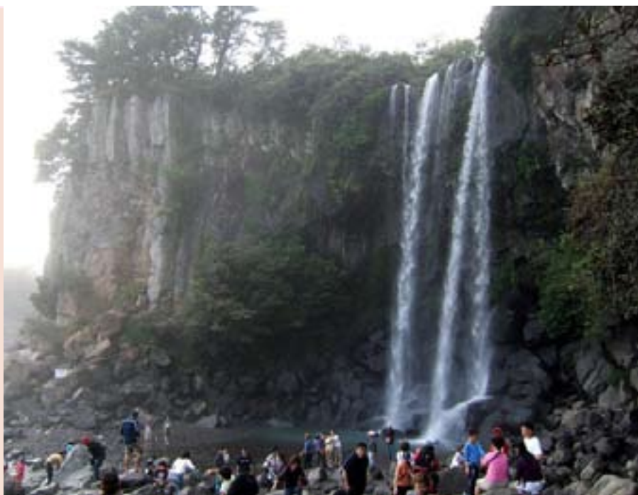
Один из водопадов на Чеджудо