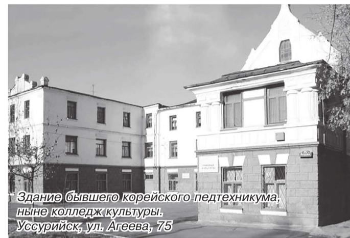
Здание бывшего корейского педтехникума, ныне колледж культуры. Уссурийск, ул. Агеева, 75

нием корейцев. И в своем рапорте архиепископу Камчатскому, Курильскому и Алеутскому Иннокентию (Иван Попов-Вениаминов) от 18 (30) ноября 1865 года «нижайший послушник иеромонах Валериан» отписывал из Посыета: «Вторично имею честь донести Вашему Высокопреосвященству, что Промысел Божий действует в сердцах корейцев... К сему содействовали внушением корейцам... унтер-офицер 4-й роты Яков Марей-