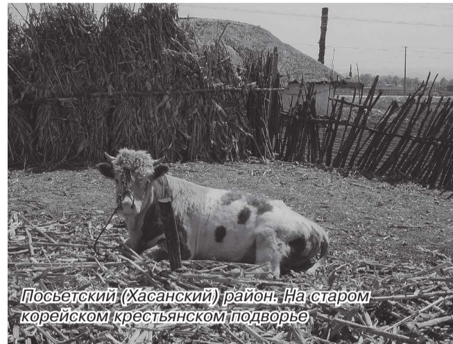
Посъетский (Хасанский) район. На старом корейском крестьянском подворье

В царское время Приморье было открыто несколько десятков начальных школ для корейских детей.