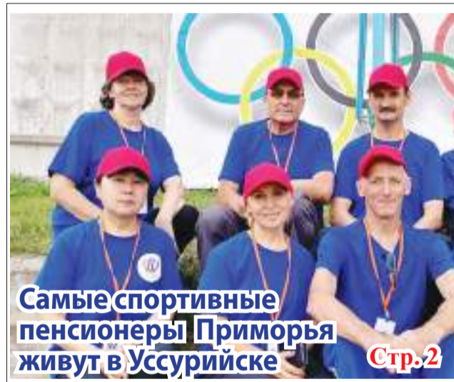
Самые спортивные пенсионеры Приморья живут в Уссурийске