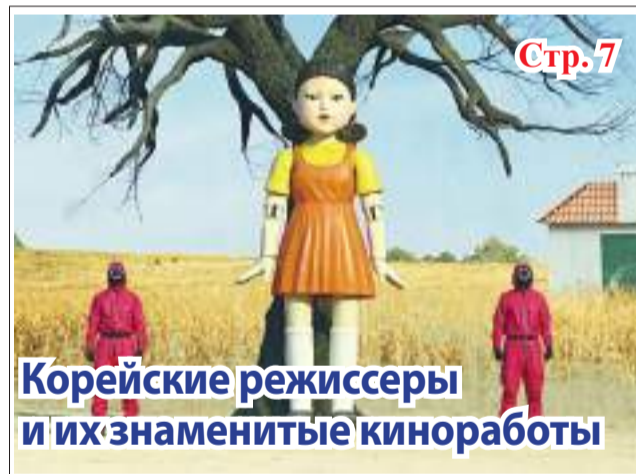
Корейские режиссеры и их знаменитые киноработы