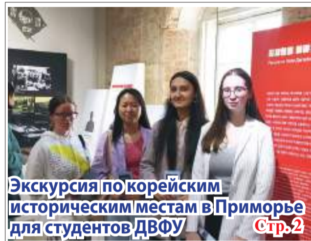
Экскурсия по корейским историческим местам в Приморье для студентов ДВФУ