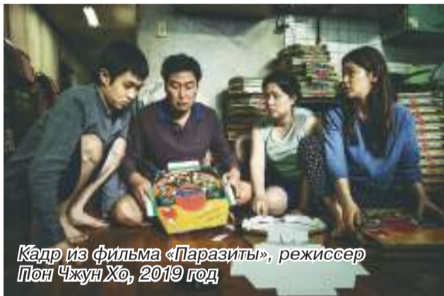
Кадр из фильма «Паразиты», режиссер Пон Чжун Хо, 2019 год

Имя этого режиссера неразрывно связано с фильмом «Паразиты», который стал первым южнокорейским фильмом, получившим премию «Оскар» и Золотую