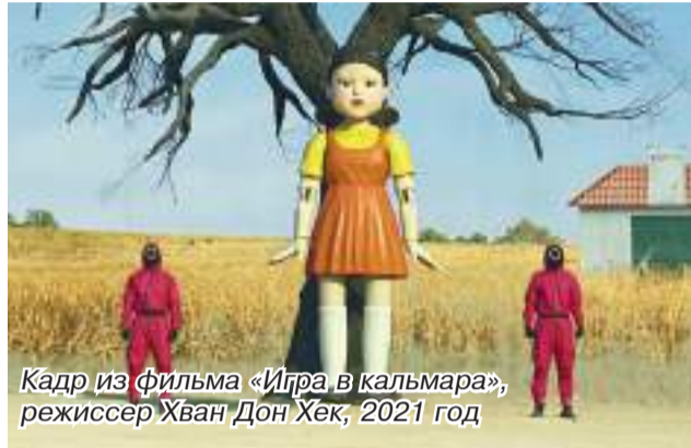
Кадр из фильма «Игра в кальмара», режиссер Хван Дон Хек, 2021 год

в действительности могла бы произойти в реальной жизни». И правда, в фильме нет на сто процентов злых и добрых персонажей. Зритель понимает, что семья Ким поступает нечестно, но не осуждает, а сопереживает