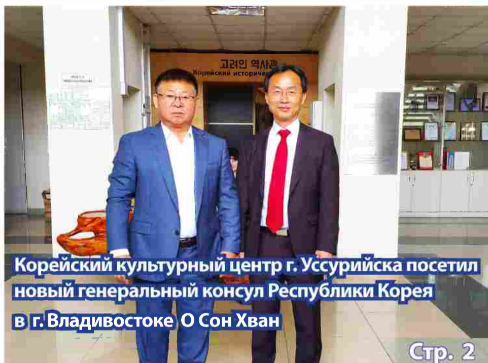
Корейский культурный центр г. Уссурийска посетил новый генеральный консул Республики Корея в г. Владивостоке О Сон Хван