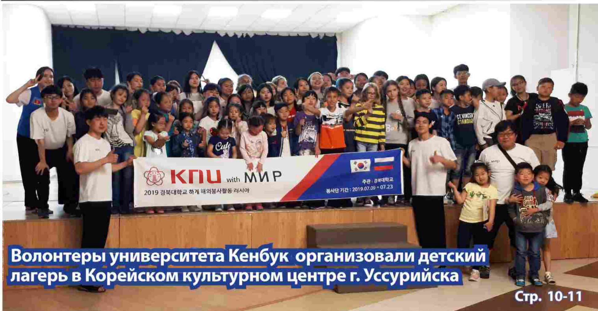
Волонтеры университета Кенбук организовали детский лагерь в Корейском культурном центре г. Уссурийска